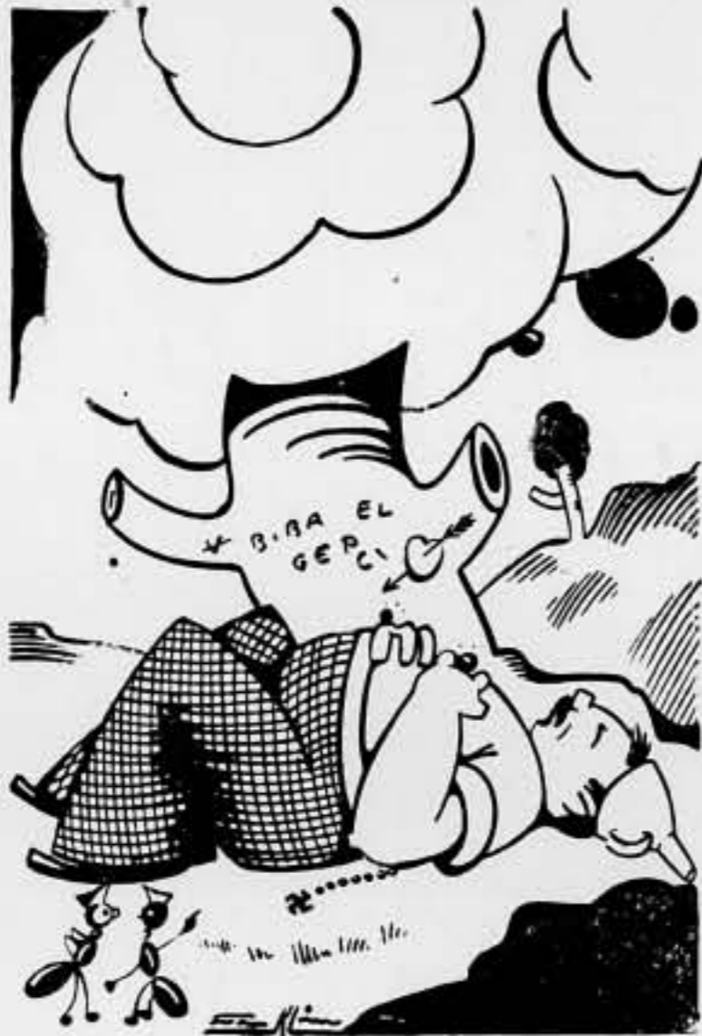
Las hormigas. — ¡Seguro que éste tiene certificado de trabajo!

Las colectivizaciones y sus antagonistas