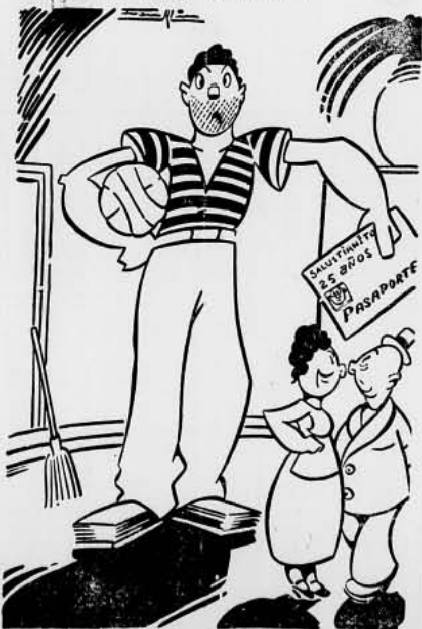
El: —¿Pero le han dado pasaporte al chico...?