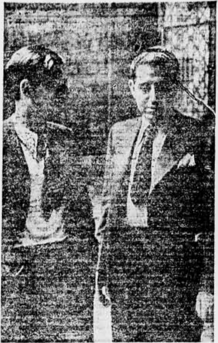
Los compañeros Xena y Eroles, al salir del despacho del Presidente

Cuánto quisiera que saliese de España la confirmación del lema: «La unión hace la fuerza!» Ginebra, junio de 1937.