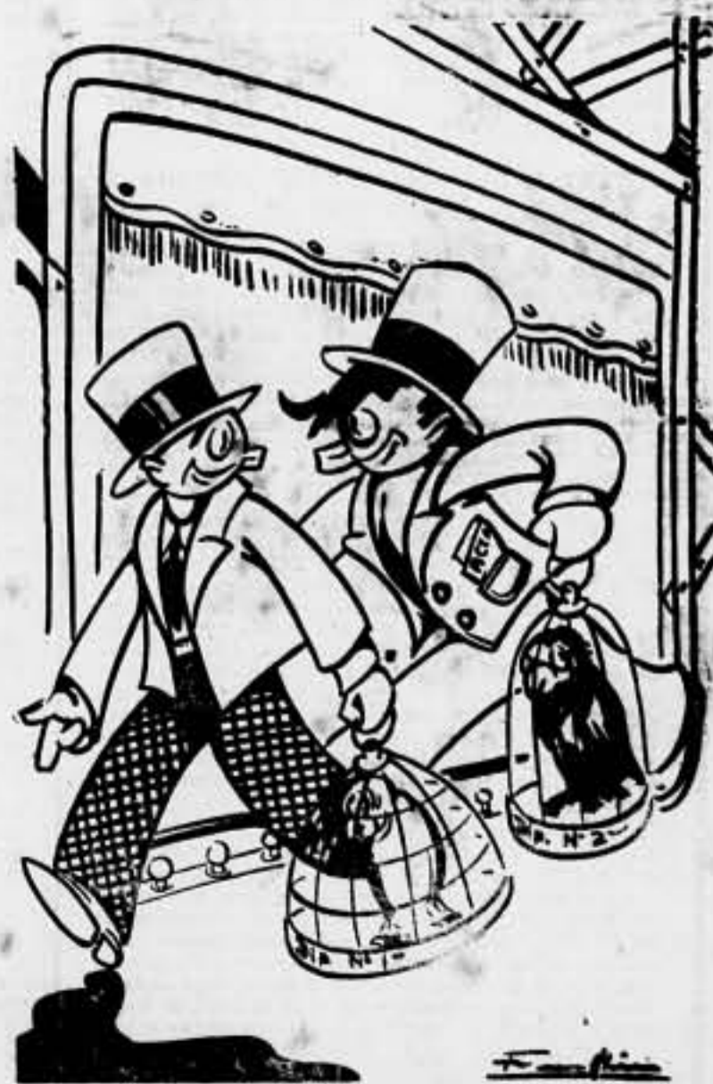
(Del último acto de una comedia)