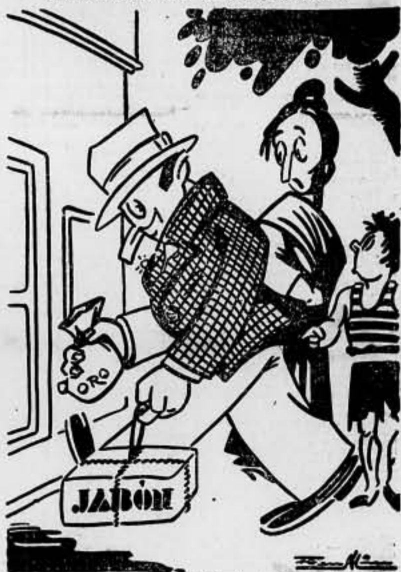
— Mamá, cuando venga papá del frente, ¿tendremos jabón, como ese "camarada"?