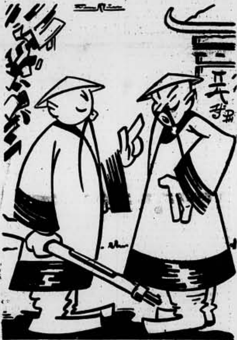
—Mucho ojo, no se entere la Sociedad de Naciones. De lo contrario, estamos perdidos.

«Unión» y «absorción» no son la misma cosa