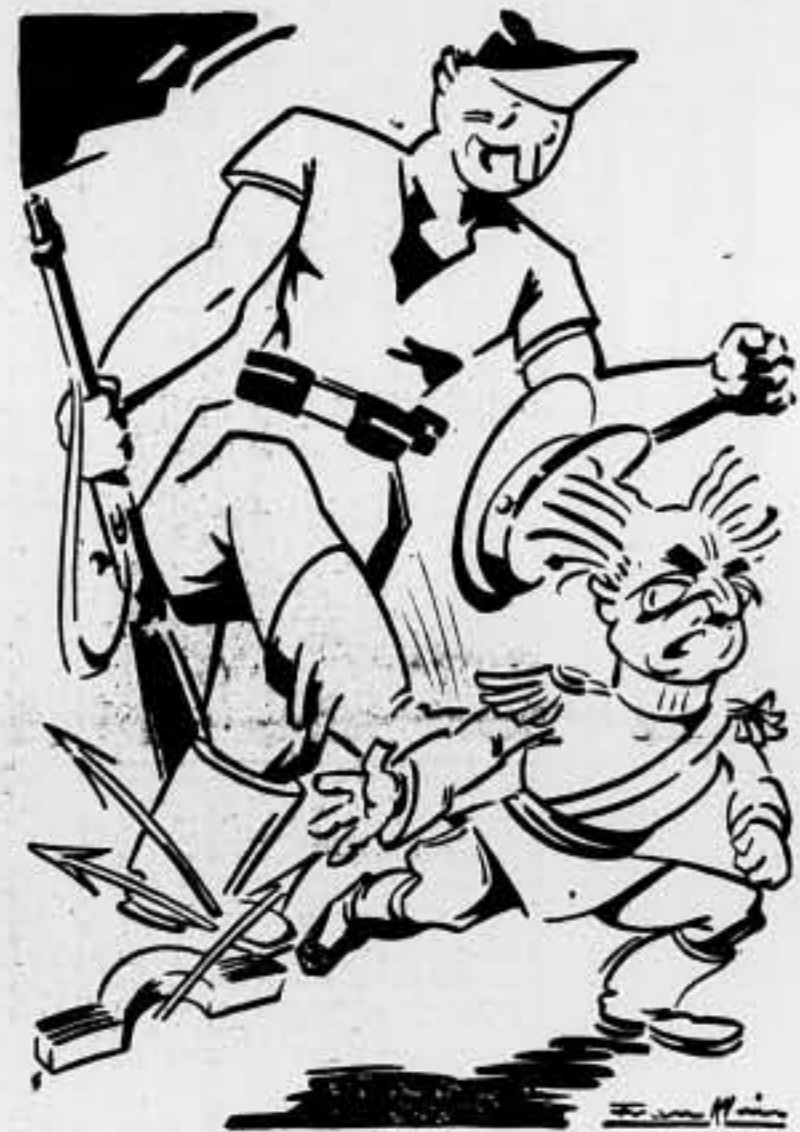
Franco: — ¡Vaya aniversario...!