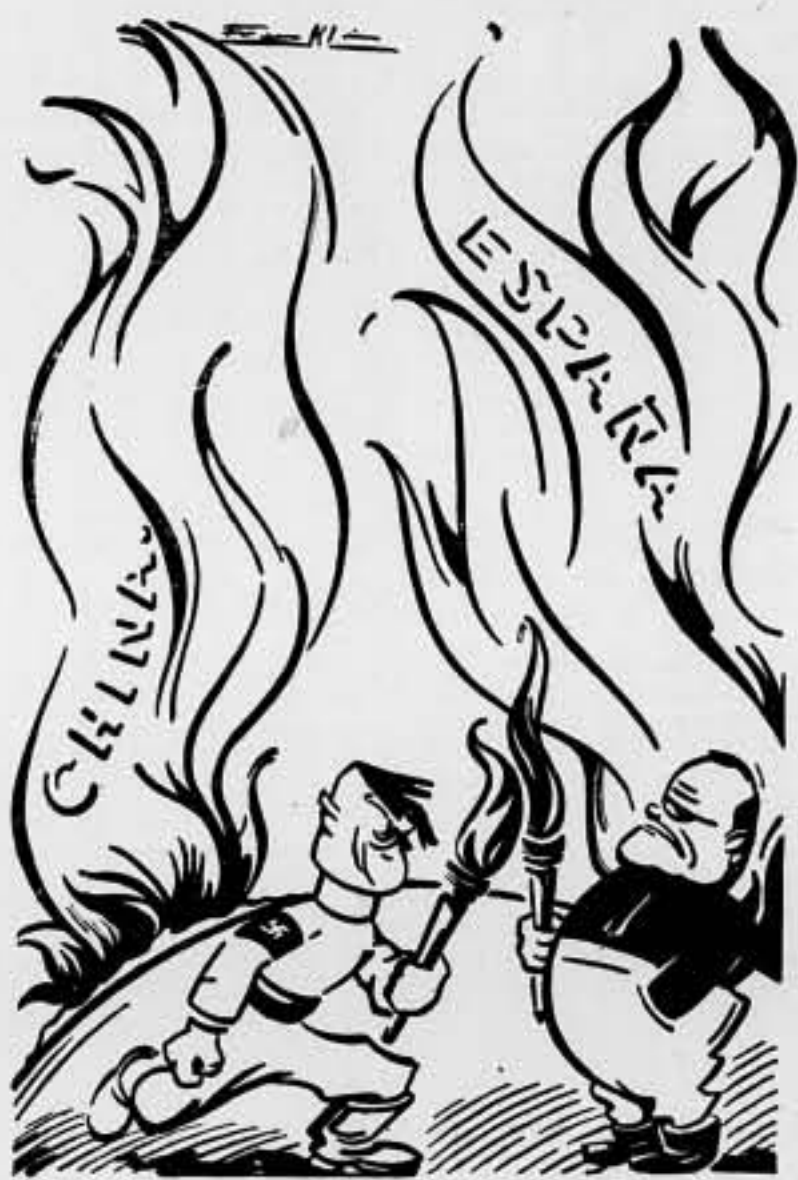
Ya empiezan a alumbrar al Mundo