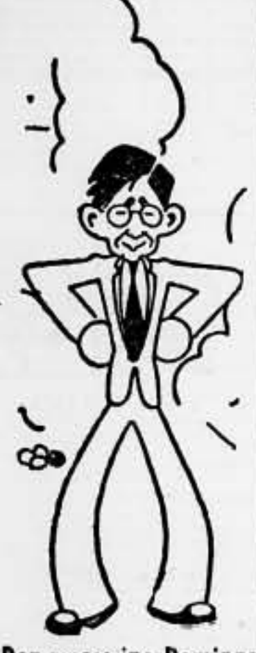
Don marce no Domingo viene a España

Méjico, 17.—El ex ministro Marcelino Domingo salió de Méjico el pasado domingo con rumbo a España. —Telexpres