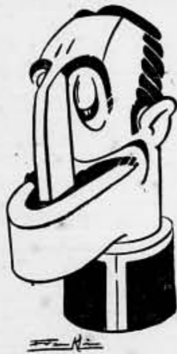
Alfonso XIII (a) «Gutiérrez»

¿Qué, piensas retornar? ¿Qué tontería! No vuelve rey que se convierte en sota; te España te arrojaron por idiota, y de Suiza te echaron por espía; deja Alfonso, insensato, que me ría ya que la risa sin cesar me brota porque al dejar que te reemplace "El Bote" te quedaste más chato que tu tia. Tienes uno hemofílico y parguato, otro mudo y el otro turulato; ¡tú eres un randa que cidió corona sin más aspiraciones que encor raja... El pueblo comprendió que eres un "guaja" y de una carcajada, te destrona.