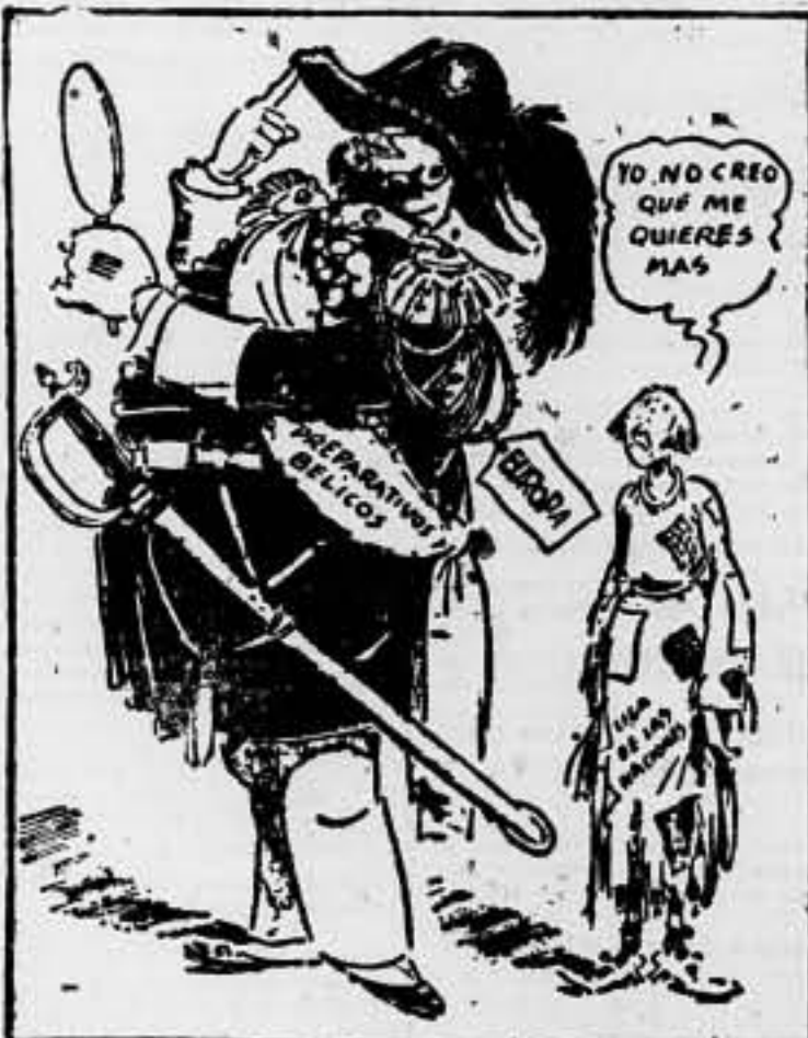
LA MUJER OLVIDADA

(Dibajo de Smith en "The Seattle Post-Intelligencer" de Seattle)