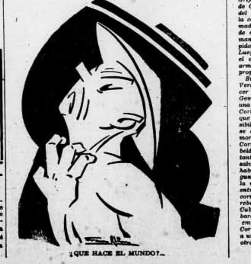
¿QUE HACE EL MUNDO?.. (Pasa a la pág. 4)