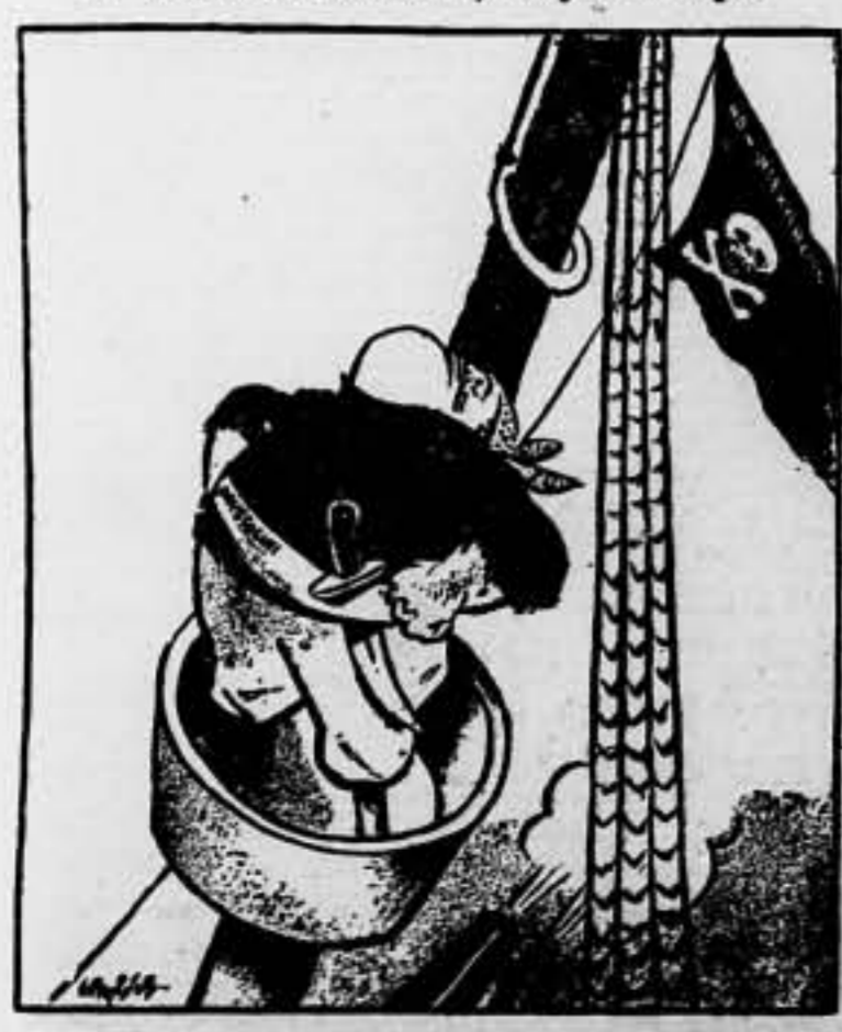
«EL ÚLTIMO PIRATA DEL MEDITERRANEO» (Dibujo de W. Gropper, en «New Masses», de Nueva York)

«El Mensajero» declara que no hay que tomar la cosa a lo trágico. De todas formas — añade —, si se llega a celebrar la Conferencia del Mediterráneo sin la participación de Italia, sus acuerdos serán completamente inútiles. — Clama.