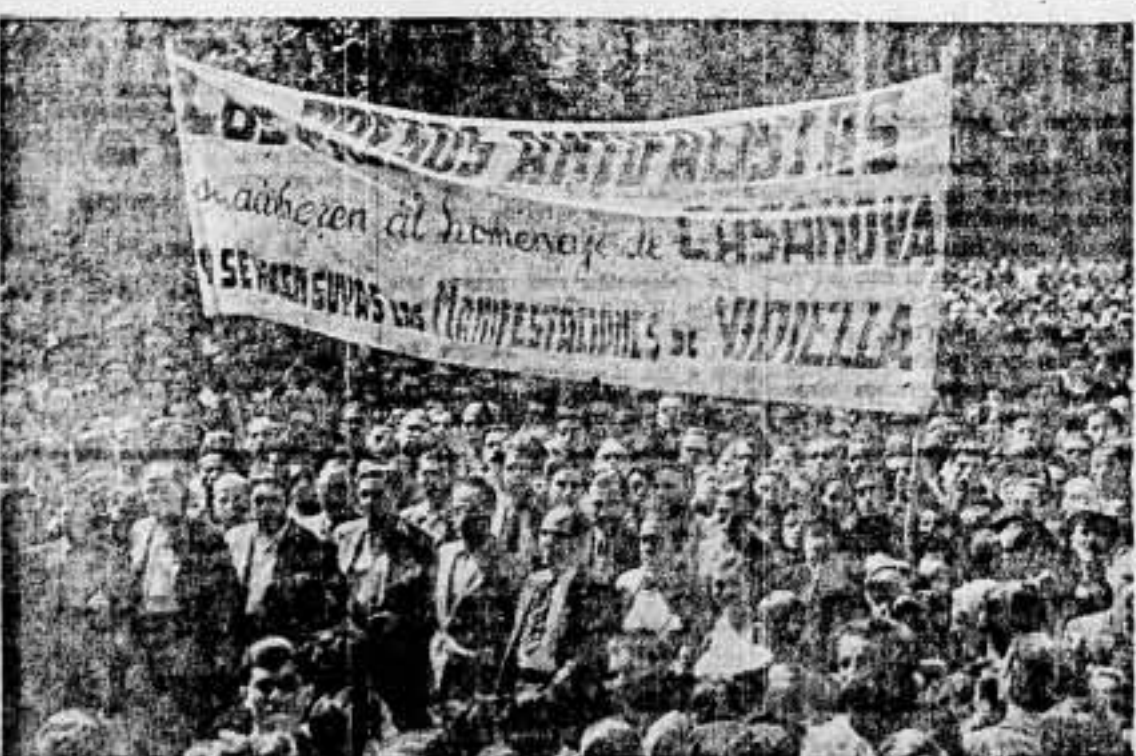
Presidencia de la manifestación anarcosindicalista ante el monumento a Casanova. Los presos antifascistas se adhieren al homenaje, con la pancarta que ve el lector.