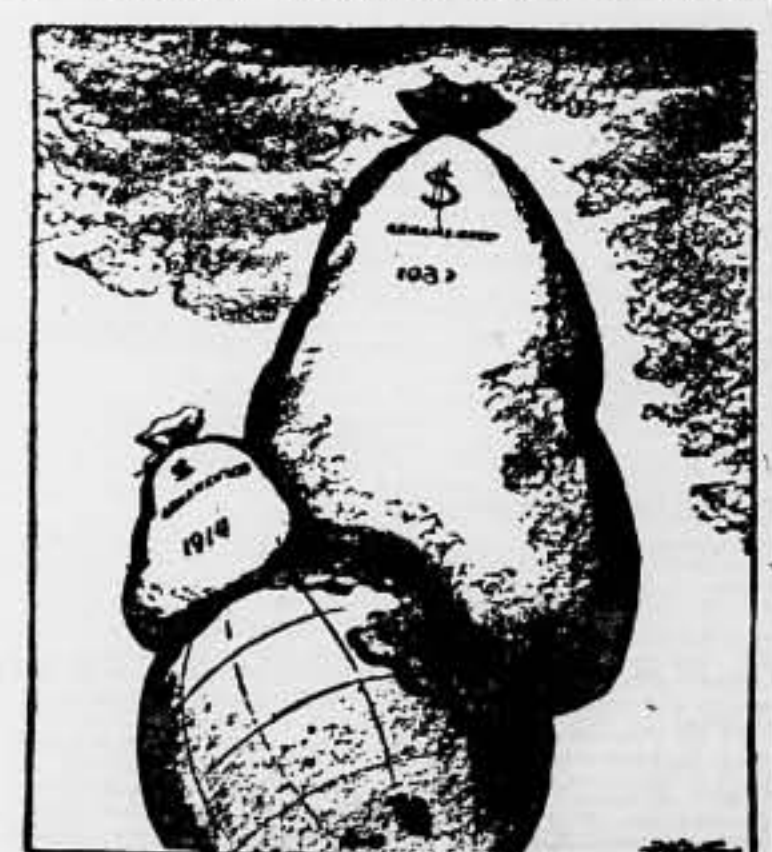
OTRA VEZ LA CARGA DE LA GUERRA (Dibujo de Fitzpatrick, en "St. Louis Post Dispatch")