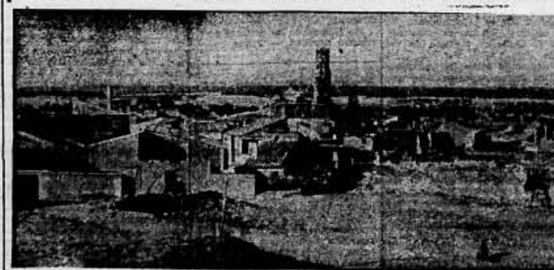
Vista parcial de Belchite, después de la lucha victoriosa del Ejército del Pueblo