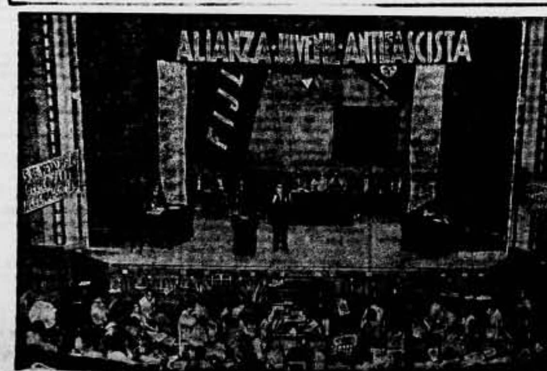
Los actos de la Alianza Juvenil, proyectan un vigor nuevo y vigoroso en la España antifascista. Vista del gran mitin juvenil de Valencia, donde unificaron anhelos jóvenes de todos los sectores.