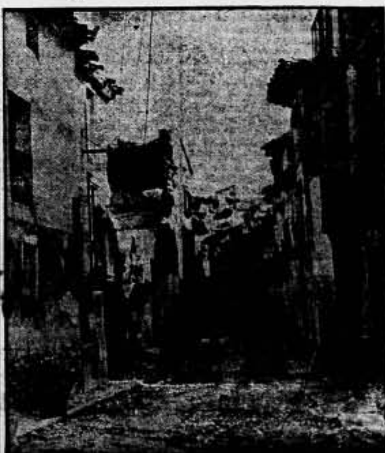
Las calles de Belchite, asoladas por la prueba de fuego, inician una nueva vida para la España proletaria.