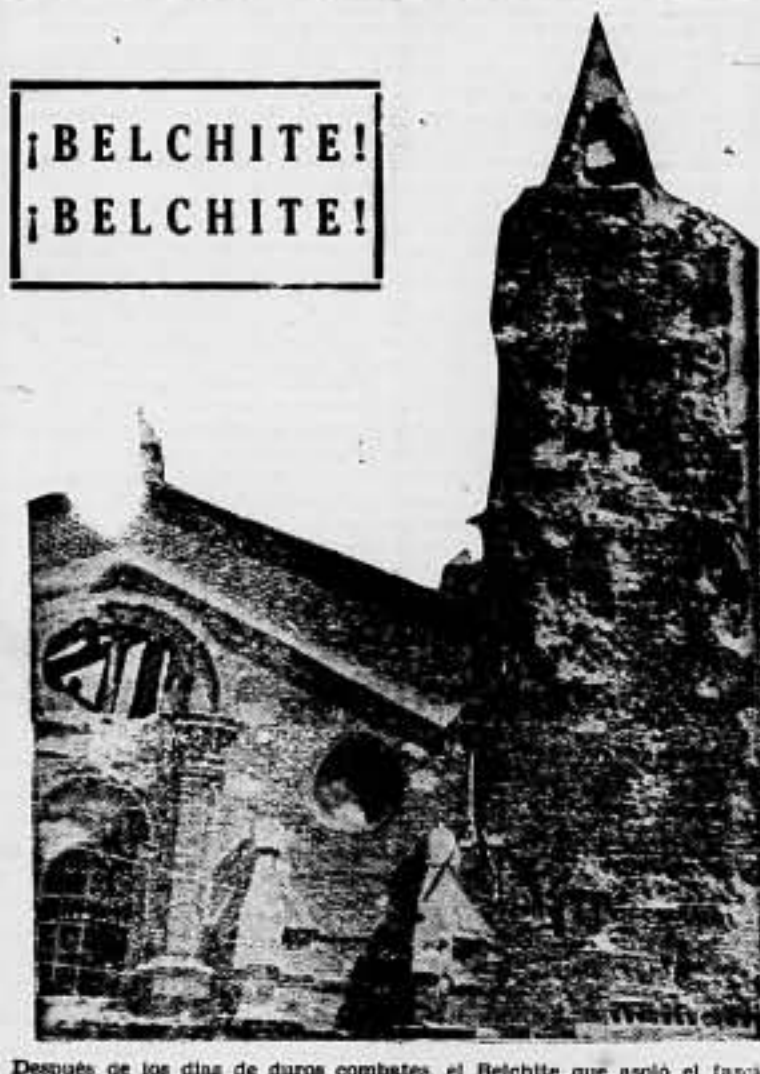
Después de los días de duros combates, el Belchite que asoló el fascismo nacional y extranjero, es recuperado para el proletariado en armas.