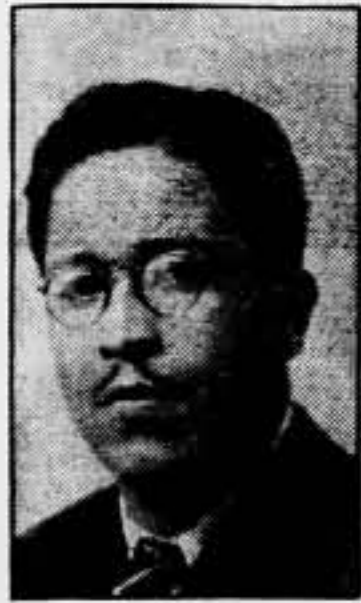
ALEJANDRO GOMEZ MAGANDA Cónsul general de México en España, e intérprete fiel de la solidaridad de su país para con la causa del proletariado español

NUNCA OLVIDAREMOS LA SOLIDARIA VOLUNTAD DE LOS TRABAJADORES DE MEXICO