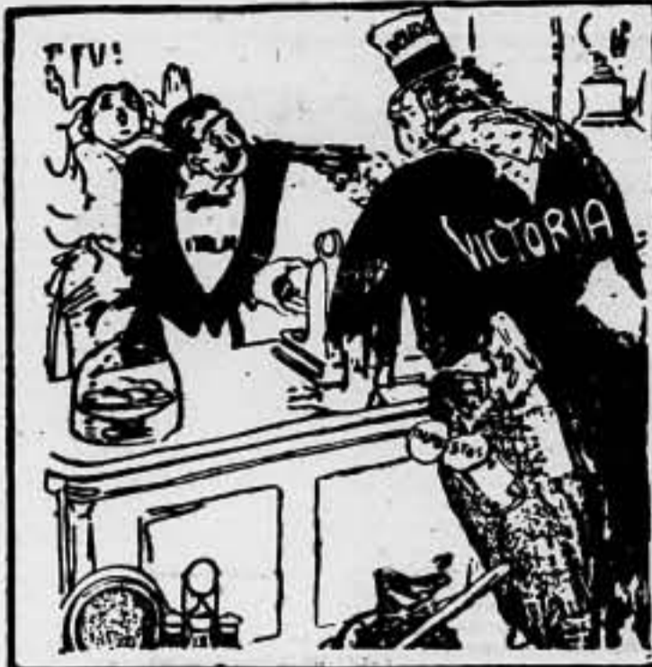
DESPUES DEL TRIUNFO MILITAR

El millonario que acaba de llegar de Abisinia