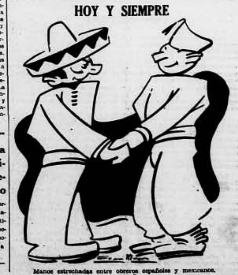
Manos estrechadas entre obreros españoles y mexicanos.

Washington, 15. — Según informaciones recibidas en el Departamento de Estado, Chile y Argentina contestarán pronto a la proposición uruguaya referente al reconocimiento de la beligerancia a Franco. La respuesta será negativa. — Fabra.