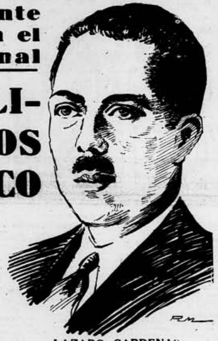
LAZARO CARDENAS Caudillo popular de la revolución mejicana digno presidente de la República amiga, que hoy conmemora el 127 aniversario de su independencia

Ellos señalaron el camino a la clase obrera de todos los países