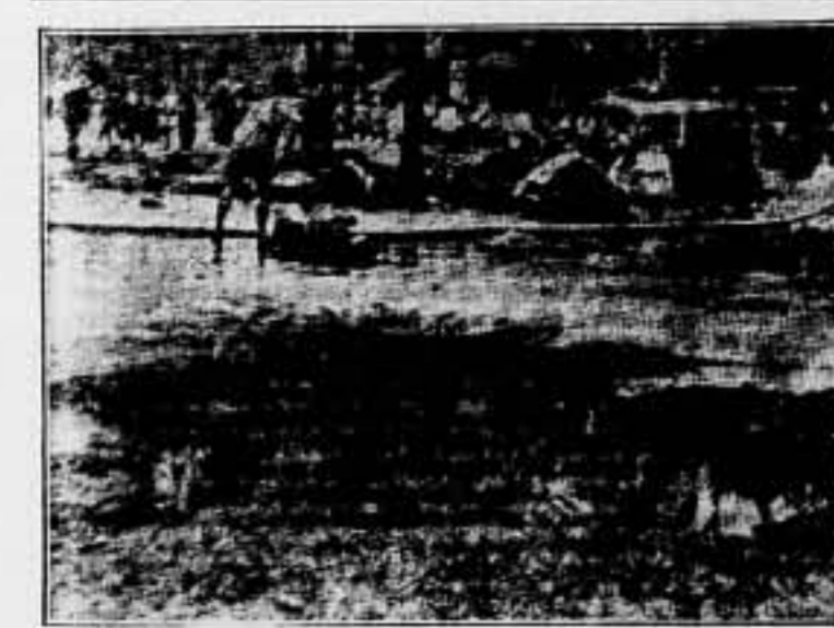
Una idea del intensivo bombardeo de guerra en Shanghai, en la Avenida Edward VII y Nanking Road