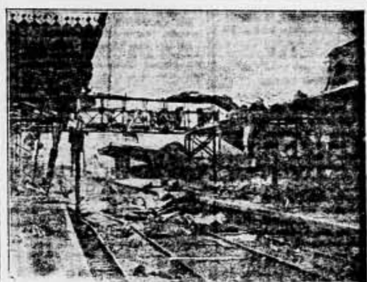
Una estación destruida. — Una escena de devastación en la estación de Nantao, al suroeste de la «Ciudad china», en Shanghai, ocasionada por un bombardeo aéreo japonés