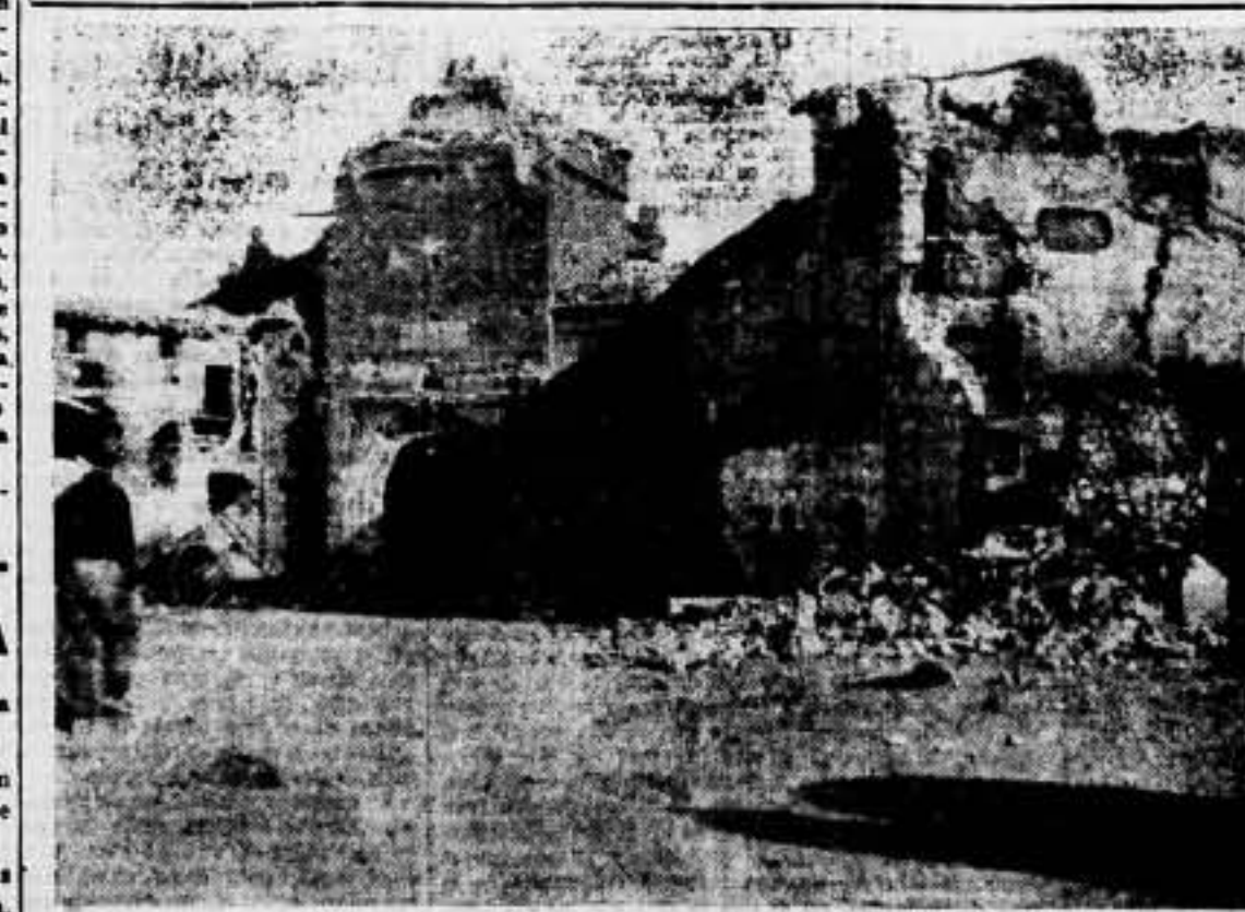
La plaza de Goya, después de la toma de Belchite por las fuerzas del Ejército Popular Revolucionario.