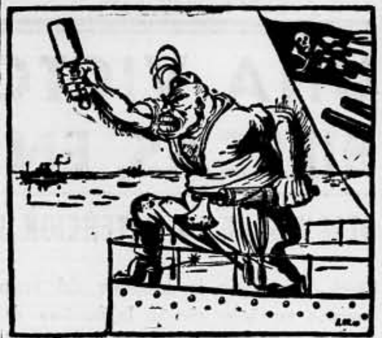
EL PIRATA CONTROLA EL MEDITERRANEO