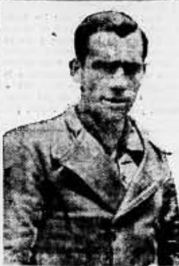
que, con el batallón que lleva su nombre, fué de los primeros que asallaron a Belchite