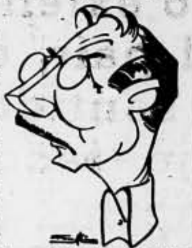
Se sabe al doctor Schacht, economista de la economía hitleriana, que, a pesar de todos sus conocimientos y su poder, se viene abajo, justo en el momento del momento más crítico...

Un estudio interesante sobre las posibilidades económicas del país de Hitler