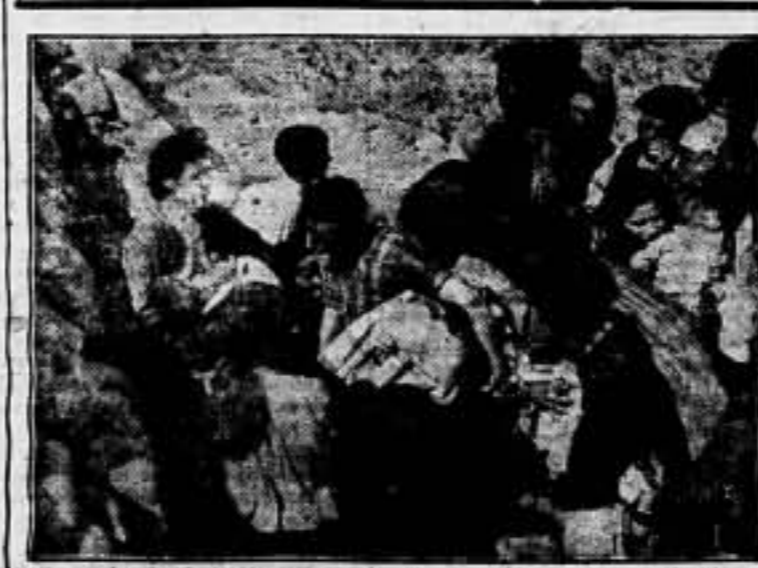
La pesadilla de los últimos meses de terror fascista en Belchite, va cediendo paso a la alegría. Reguardados a la entrada de un refugio, los campesinos aragoneses miran en contacto con un mundo nuevo, contemplado para ellos por los soldados del pueblo.