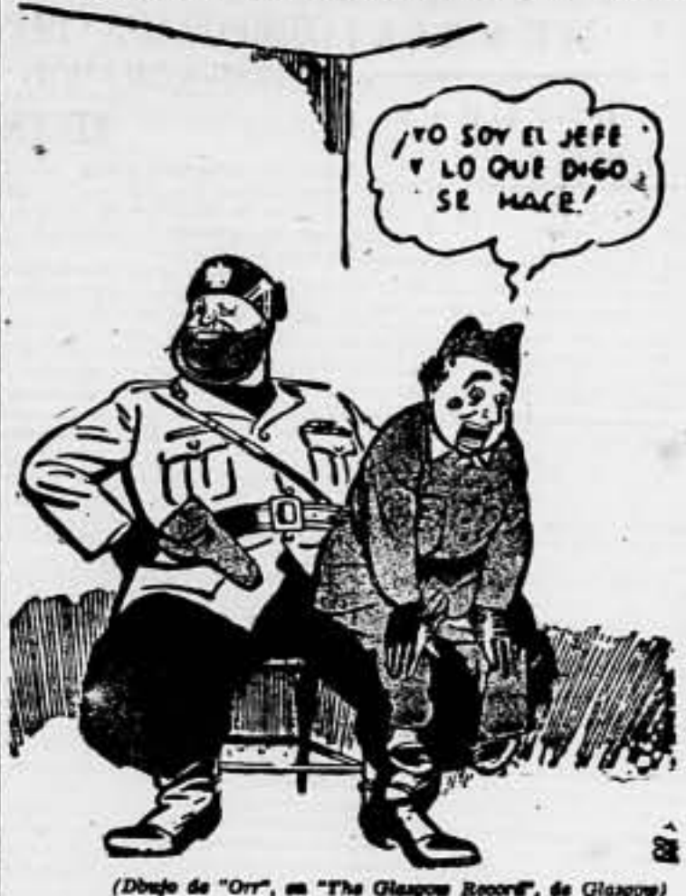
(Dibujo de "Orr", en "The Glasgow Record", de Glasgow)