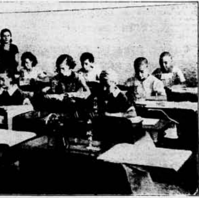
Méjico los ha unido en la fraternidad infantil y el trabajo juega y expresión de solidaridad también a los que luchan por ellos en la España antifascista.