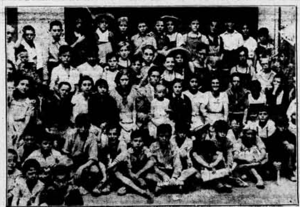
Niños españoles, de todas las regiones de la España real, han encontrado en las instituciones y el pueblo mejicano una real y viva fraternidad...