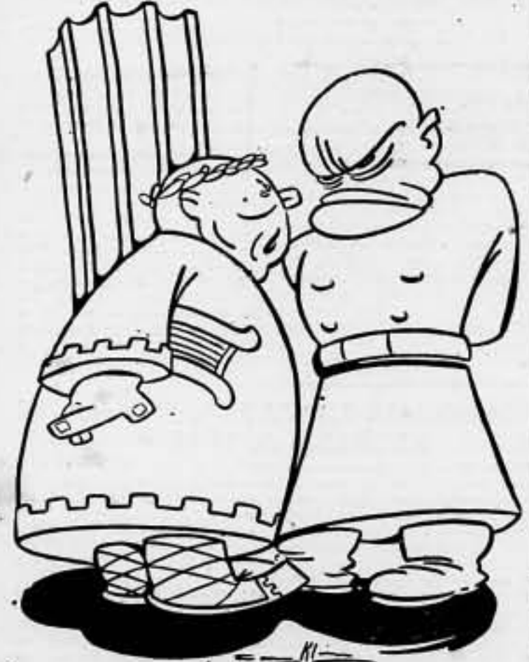
Neron: — ¡Podrás ser todo lo animal que quieras, pero a lo que me resigno es a que me ganes en ser criminal!