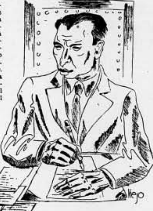
Nuestro camarada Domingo Torres, alcalde de Valencia