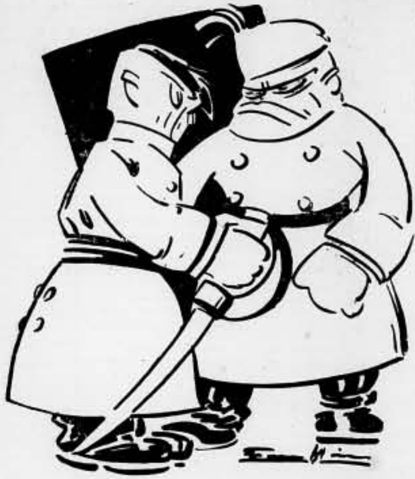
CON ACUERDO Y SIN ACUERDO, SEGUIREMOS SIENDO PIRATAS

Nosotros, ajenos al organismo parlamentario, esperamos que sus integrantes sabrán cumplir con su deber antifascista y que tendrán en cuenta las circunstancias nuevas que han de condicionar su acción.