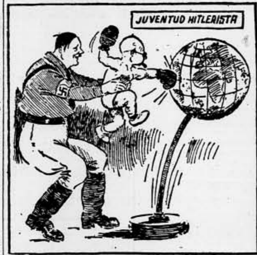
LA EDUCACION FISICA EN ALEMANIA (De "The Birmingham Mail", de Birmingham)