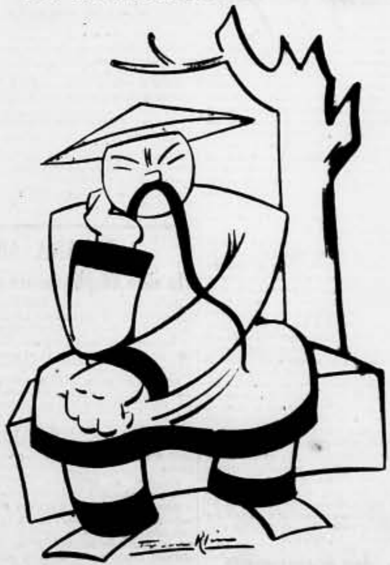
El Comité de los Veintitrés ha acordado protestar enérgicamente contra los bárbaros bombardeos de que somos objeto. ¡Lástima que tanta "energía" la gasten sólo en el papel!

Este número ha sido visado por la previa censura