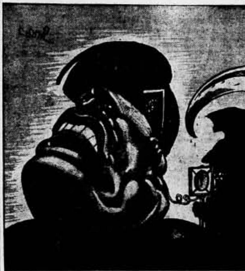
Cabrol, en "L'Humanité", París