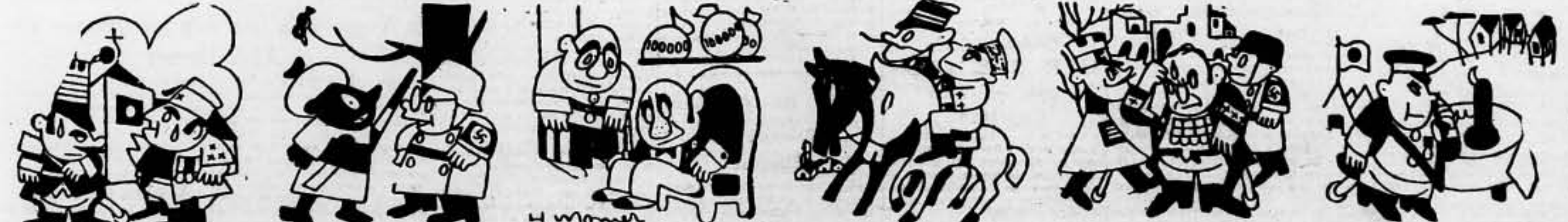
—Si no ocupamos a Madrid, está descontento: Madrid nos copará a nosotros.