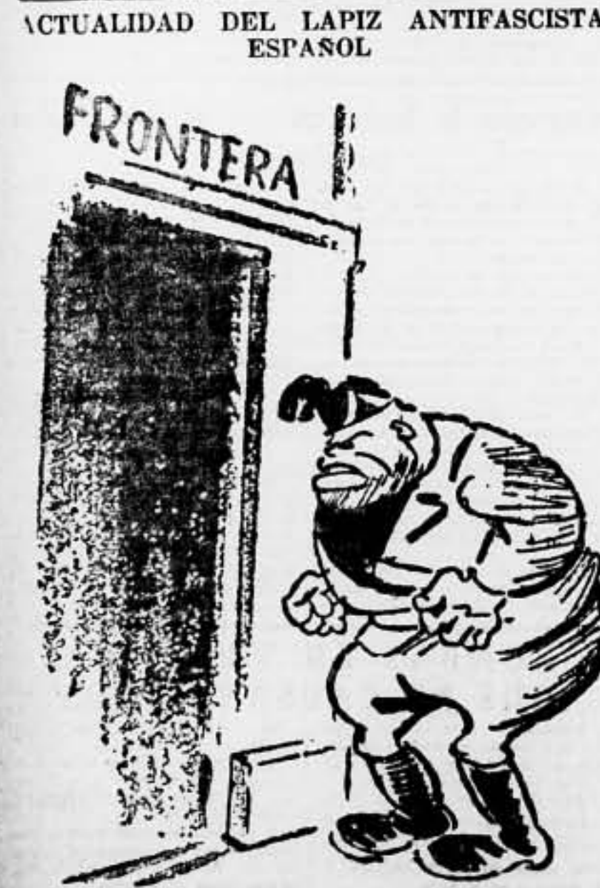
A ELABORAR por Robledano, en "Claridad" Mensual. — ¡Se abre el debate! ¡Quieren abrir!