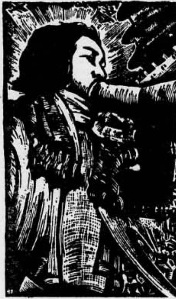
Los estudiantes chinos hablan al pueblo de su liberación

Y para seguir con política de "la cáscara de naranja"