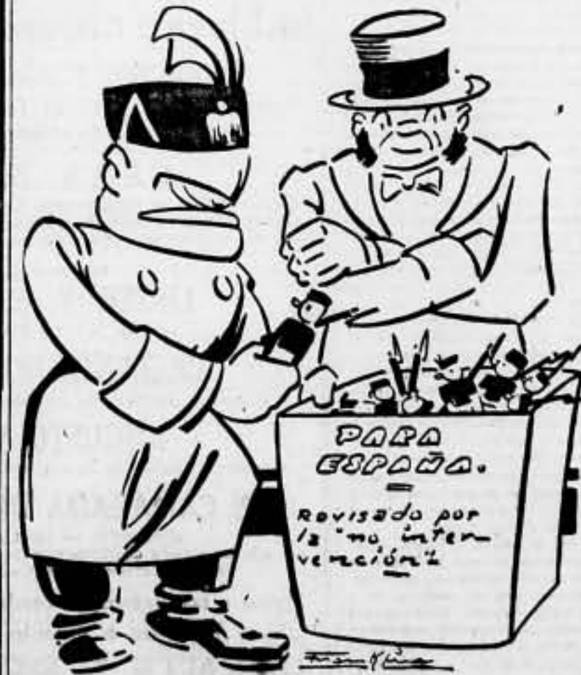
Mussolini piensa: «Seguiré haciendo mi real gana... John Bull para él: «Es un crimen; pero la culpa no es más sino del Comité...»