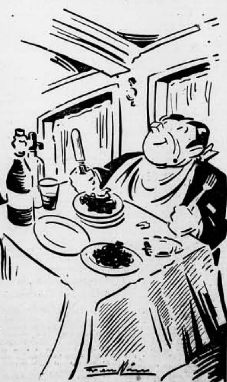
—Bien. En el café diré que tenemos que ser sobrios y sacrificarnos por la guerra. Pero... eso no es sino para desfogar.

En el frente extremeño es rechazado energicamente un ataque enemigo