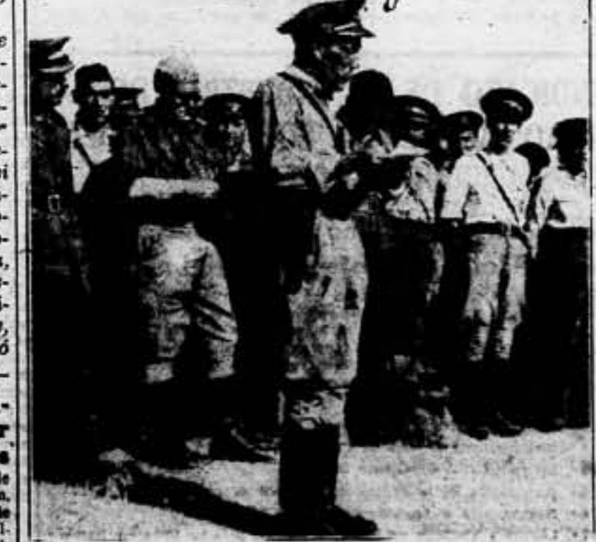
FRATERNIDAD DE LOS MILITARES PROLETARIOS CON SUS HERMANOS DE CLASE EN EL MADRID HEROICO, CIPRIANO MERA