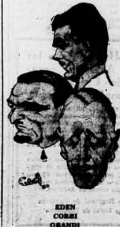
EDEN CORRI GRANDI

Londres. — En los círculos bien informados se considera que las advertencias formuladas por Eden en su importante discurso de la noche constituyen un feliz acierto sobre el desarrollo de la presente reunión del Comité de no intervención.