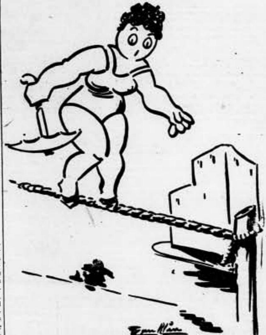
La "no intervención" haciendo equilibrios

"C N T" ANTE EL DISCURSO DE LARGO CABALLERO