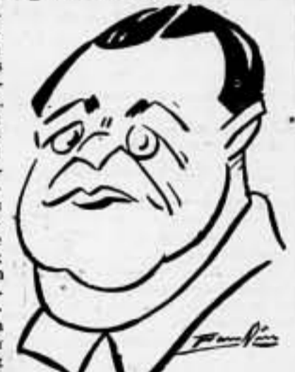
El "general" Goering

Con esto ponemos fin al reportaje sobre las actividades nazis para intervenir en el Mediterráneo.