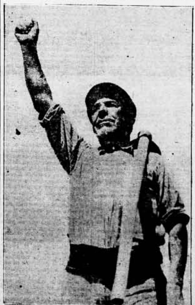
El descanso campesino no es ya la penuria en el alma y en la gheba, bajo la opresión del amo feudal. Este descanso es paz y es promesa de una vida feliz. A la faena cumplida, el puño alzado, levante el estandarte de una España campesina libre