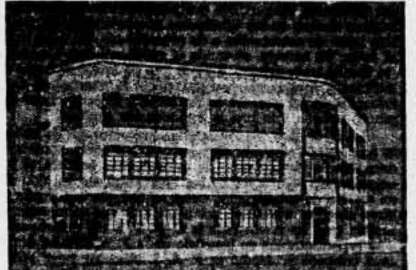
Edificio recién concluido, destinado a taller de conciencias

—Mucha y muy importante. Tenemos en construcción diez policlínicas —una en cada distrito— que, una vez terminadas, vendrán a llenar el vacío que se hacía sentir en Barcelona, en este aspecto, que es el mismo