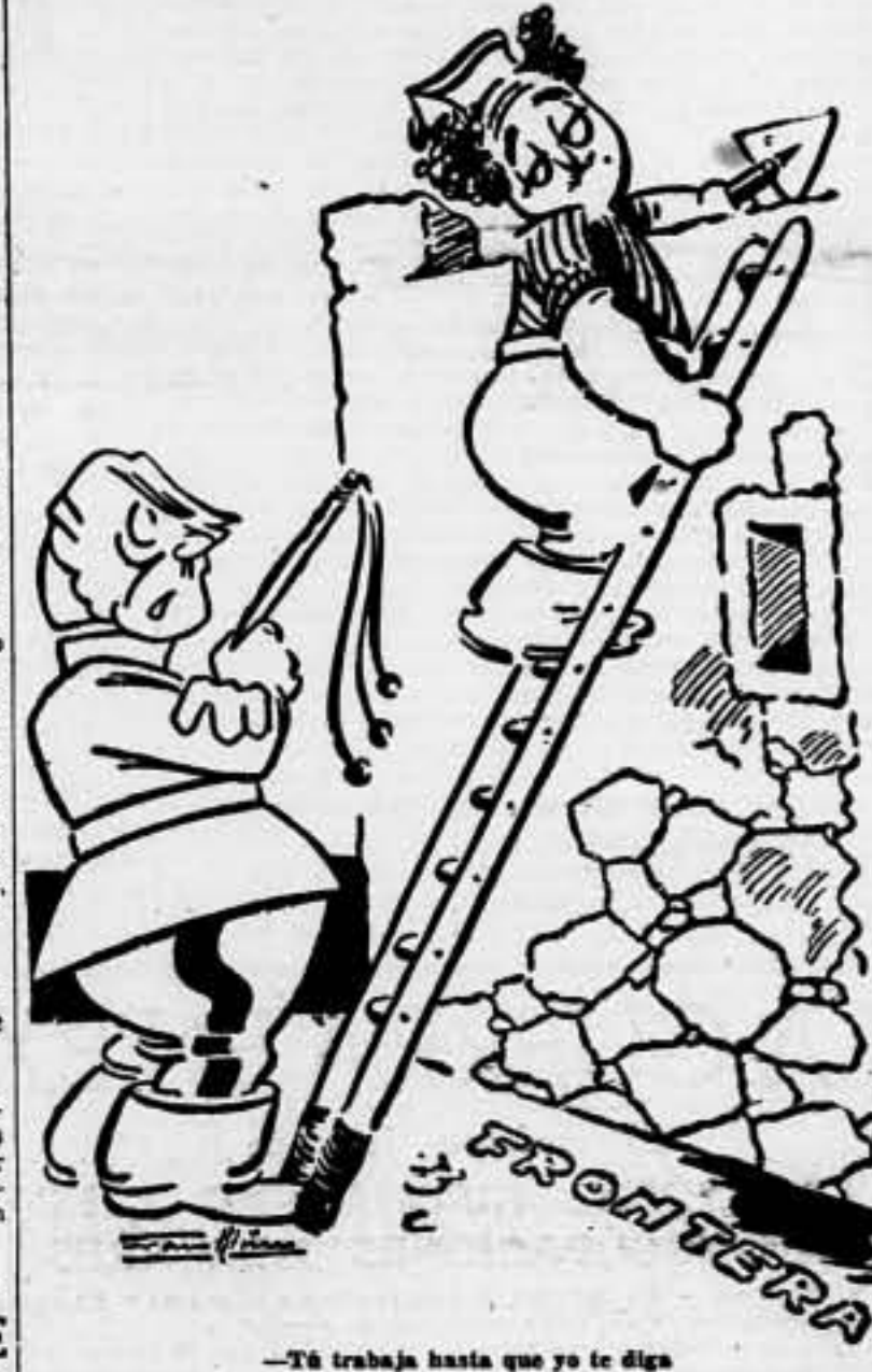
Tú trabaja hasta que yo te diga