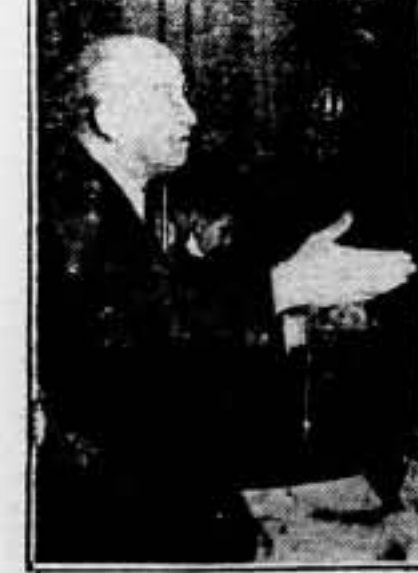
El camarada Largo Caballero, en un momento de su discurso del pasado domingo, en Madrid, organizado por la Sección de Afiliados «El Trabajo».