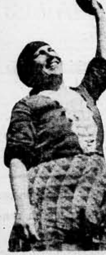
El momento que hace guardia en los parapetos, es su orgullo, sangre de su sangre. Floreció a sus veinte años de la vega o la comarca. Sorriente, dará en sus sentimientos, el mensaje proletario y guerrero de su hijo soldado, en su fuerza y su contento

Berlin.—De fuente responsable se declaran desprovistas de fundamento las informaciones circuladas en el extranjero asegurando que el actual embajador del Reich en Londres, Von Ribbentrop, abandonaría próximamente este cargo que pasaría a ser desempeñado por el titular de la embajada de Alemania, en Roma, Von Hassel. También se desmienten que Von Papen, plenipotenciario en Viena, vaya a substituir a Von Hassel en la capital de Italia. En apoyo de este mentís se pone de relieve que Von Ribbentrop, además de la embajada del Reich en Londres, desempeña el cargo de jefe delegado de Alemania, en el Comité de no intervención, por lo que hallándose ésta en plena deliberación sobre problemas extremadamente delicados relacionados con la guerra de España, "su llamamiento por el Gobierno de Berlín sería poco conforme con los usos y tradiciones de la diplomacia." Esta explicación induce a creer que la substitución de Von Ribbentrop ya ha sido decidida y que su ejecución es sólo cuestión de tiempo, ya que los círculos oficiales alemanes declaran que las actuales deliberaciones del Comité de no intervención han entrado en una fase capital.—Cosmos.