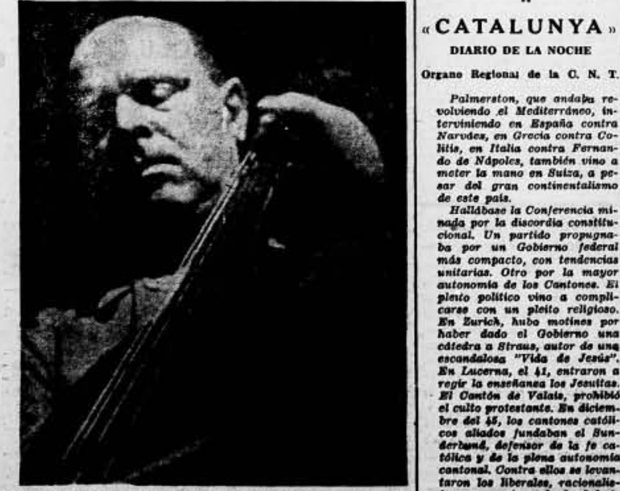
Luego de una brillante actuación en el extranjero, donde llevó la representación artística de la España real que lucha y estalla, se encuentra otra vez con nosotros, en su puesto de combate antifascista