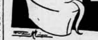
En los círculos políticos de Berlín muestran una gran reserva, quizás porque no saben gran...