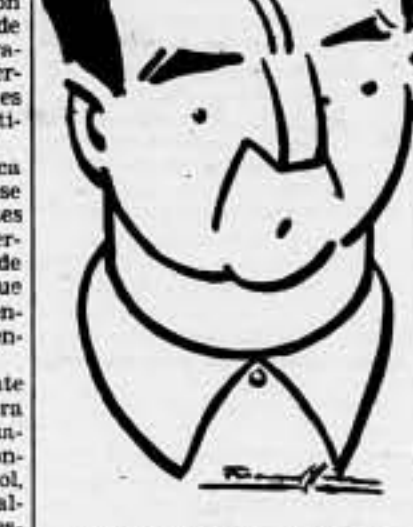
EL ASEPIO AL ALCAZAR

LA EVASION. ¿Y cómo pudo evadirse?—Inquirimos de nuestro interlocutor. —Fui detenido—nos responde—, acusado de marxista.