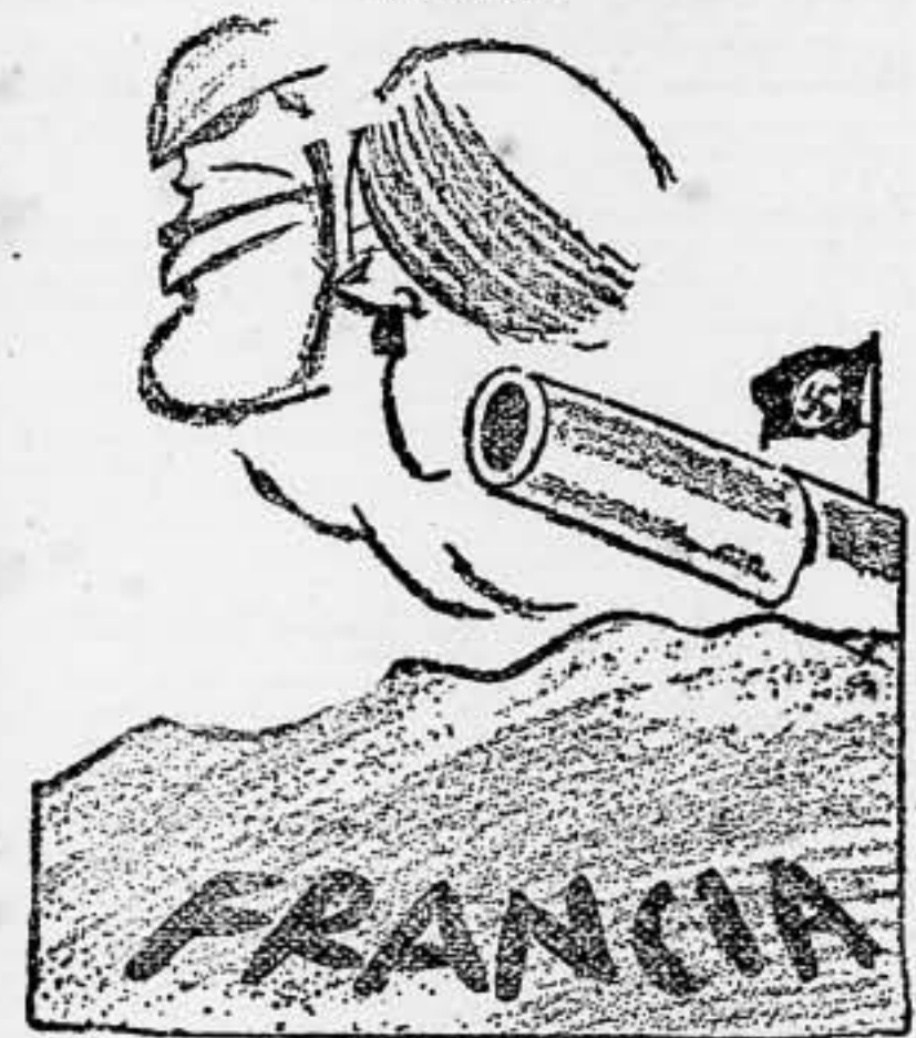
"CUANDO LAS BARBAS DE TU VECINO..."

ACTUALIDAD DEL LAPIZ ANTIFASCISTA ESPAÑOL