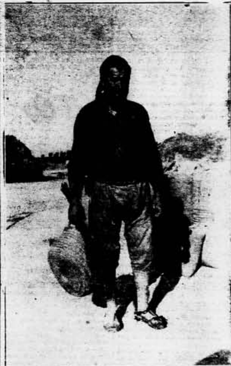
En tanto los jóvenes se batían en los frentes, los hombres de la cruzada proletaria, prosiguen su labor incansable: este arrocero de Amposta, como todos los cultivadores de nuestro campo, ayuda a ganar la guerra.

La fe en la victoria del proletariado tiene una base inconvertible: disponemos de la fuerza y combatimos en nombre de la Justicia.