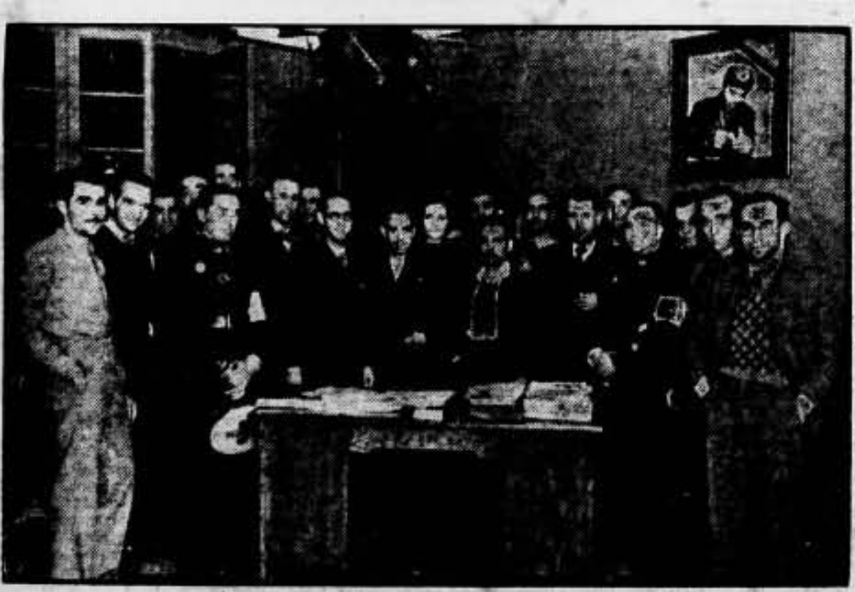
ACTO DE LA ENTREGA DE LAS 16377 PESETAS A LOS HOSPITALES DE SANGRE, FONDOS RECAUDADOS POR «SOLIDARIDAD OBRERA» DESDE MAYO A LA FECHA.