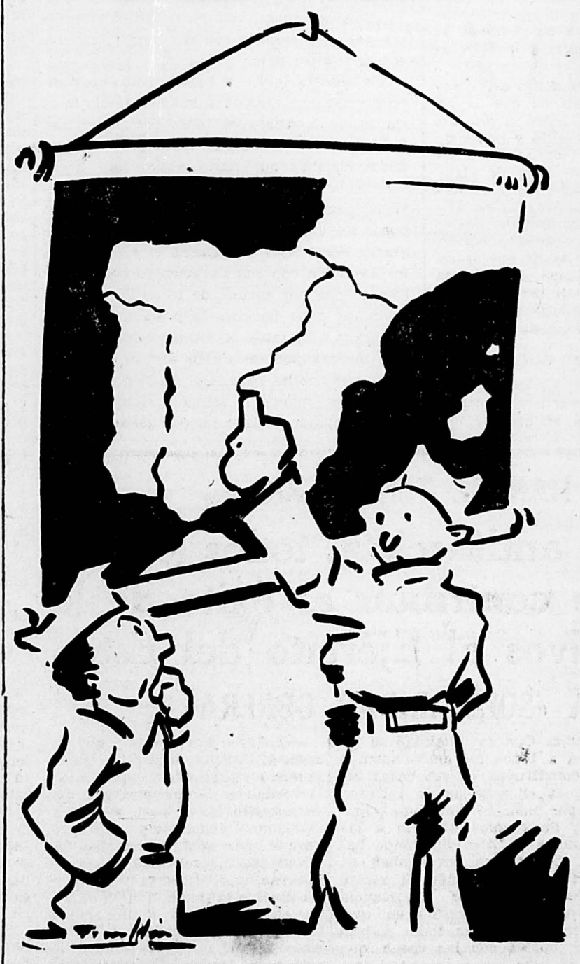
—Sobre esta línea triunfaremos. Tenedlo presente tú y los tuyos.