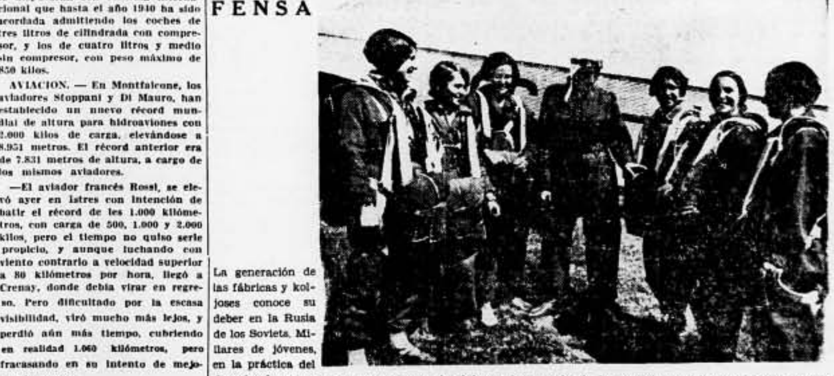
La generación de las fábricas y koljoses conoce su deber en la Rusia de los Soviets. Millares de jóvenes, en la práctica del deporte de masas, se preparan para la defensa de su suelo de las agresiones del imperialismo mundial