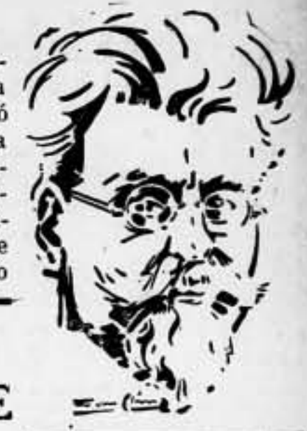
Figura contemporánea del anarquismo internacional, su contribución a la defensa de la Revolución rusa asumió todos los aspectos, desde la Prensa hasta las esferas del movimiento sindical obrero. Sus juicios, además, sobre los acontecimientos rusos, recopilados en libros, son un valioso índice de orientación para el lector proletario