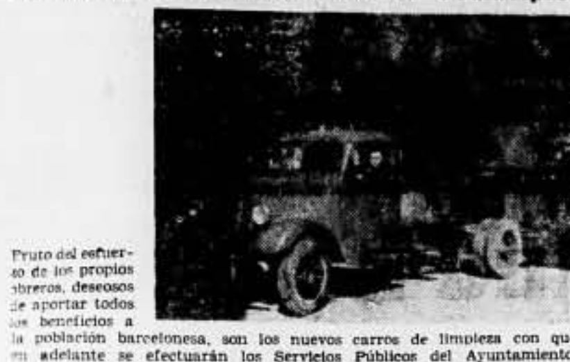
Fruto del esfuerzo de los propios obreros, desearios de aportar todos los beneficios a la población barcelonesa, son los nuevos carros de limpieza con que en adelante se efectuarán los Servicios Públicos del Ayuntamiento.