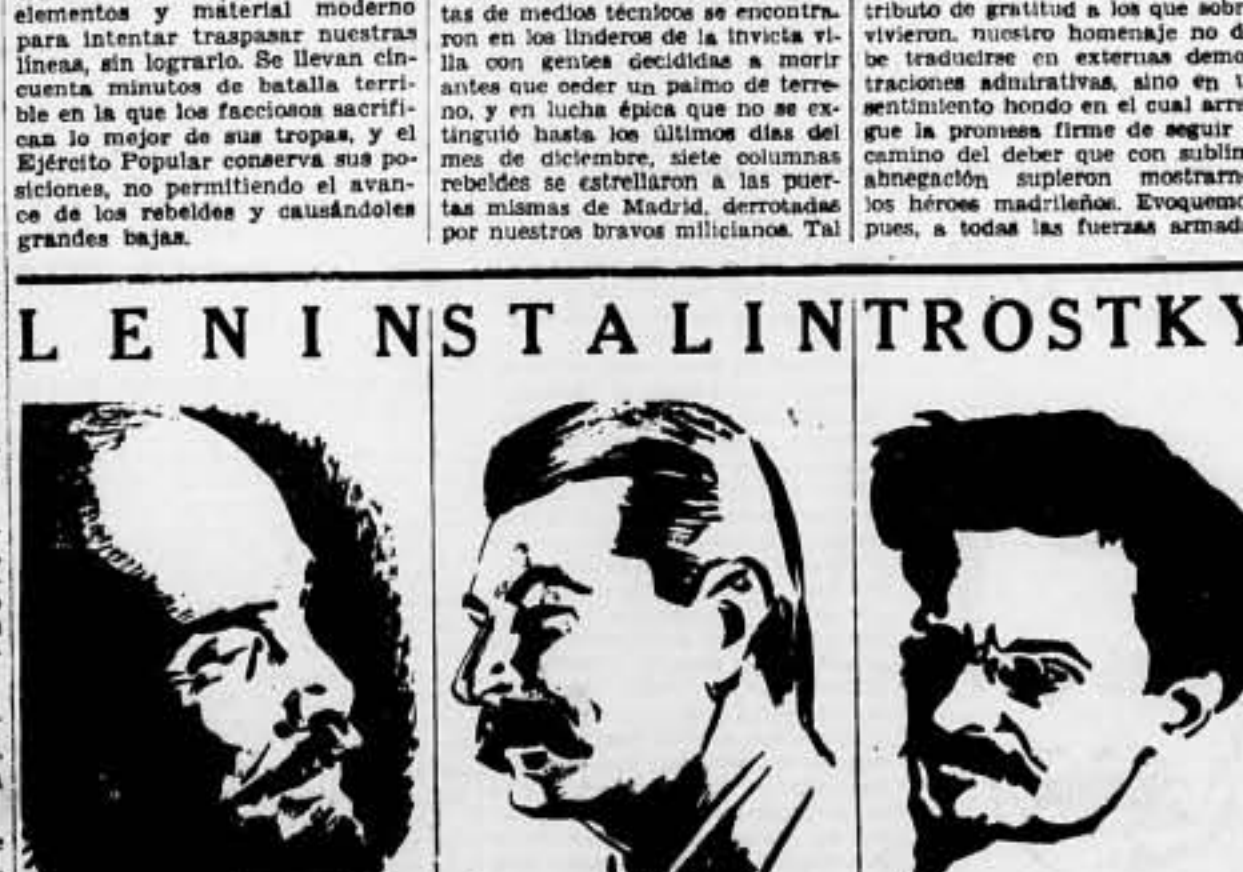
Lenin, forjador teórico y táctico del Partido Bolchevique de la primera hora, jefe del período inicial de la Revolución de Octubre y cerebro de la misma.