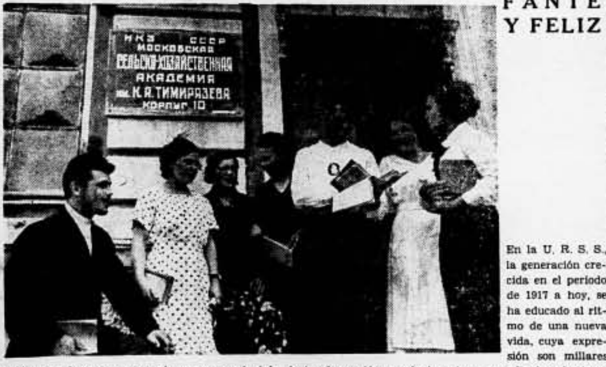
de jóvenes obreros y campesinos que conducirán la transformación revolucionaria a sus finales destinos.