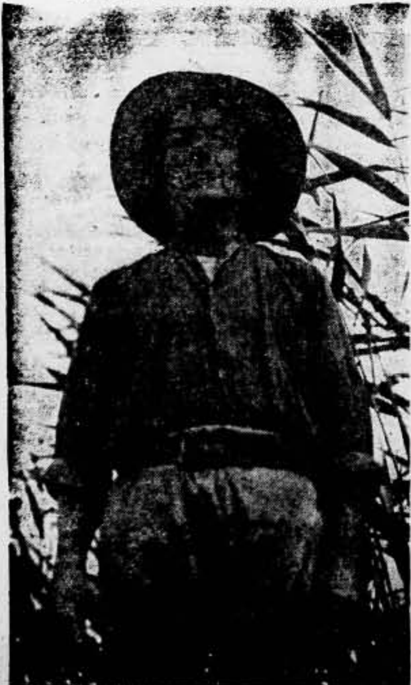
Un campesino que hasta los lideres de la vejez, conserva su alegría y su esperanza en el porvenir