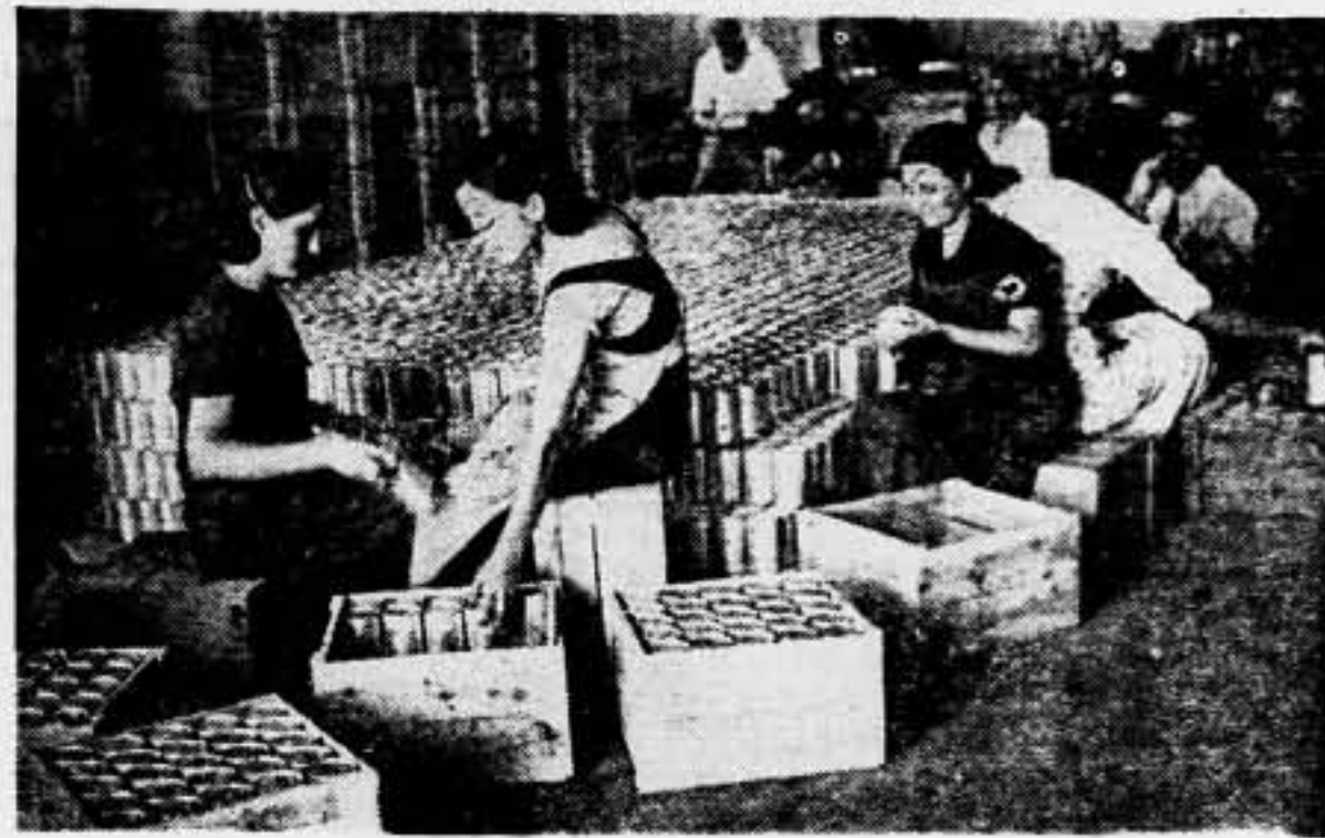
Las compañeras consagran su vida a la actividad fabril del trabajo en una jornada intensiva