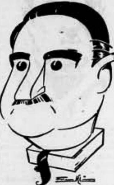
experto en sanidad de la alimentación y el director general de Abastecimientos como secretario. Presidirá esta Comisión el presidente del Consejo o en delegación suya, el subsecretario de la Presidencia.

Disponiendo se constituya adscrita a la Presidencia del Consejo, una Comisión Interministerial de coordinación de los servicios de abastecimientos y que estará compuesta por un representante del Ministerio de Agricultura, otro de Defensa Nacional, los subsecretarios de Economía y Hacienda, un