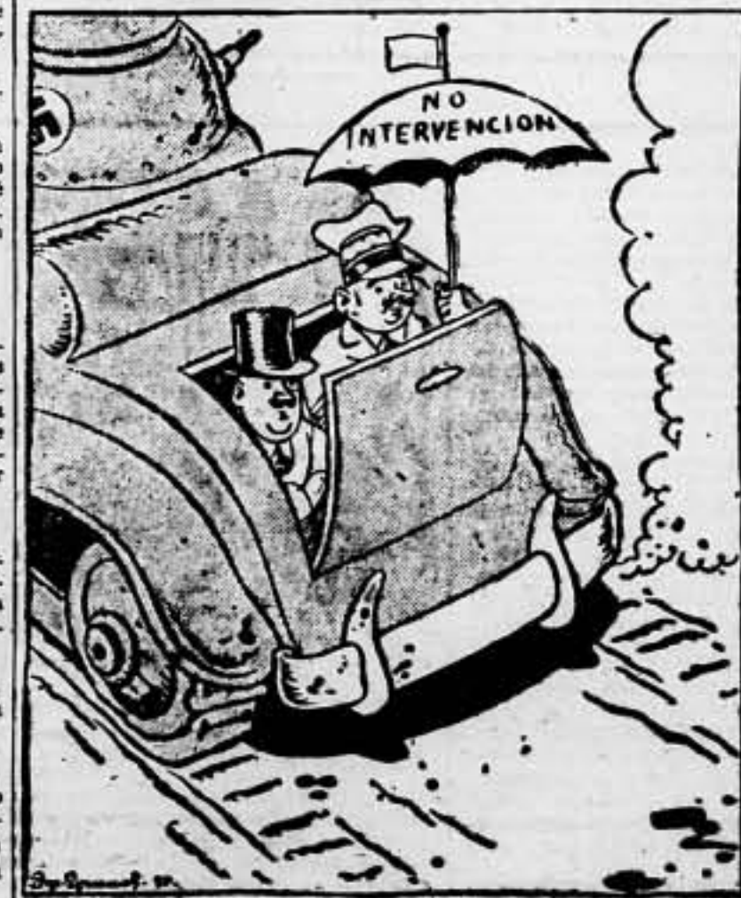
BAJO EL PARAGUAS DEMOCRATICO Los embajadores y agentes provocadores del eje Roma-Berlin continúan su tarea. (De "Arbetaren", Suecia)