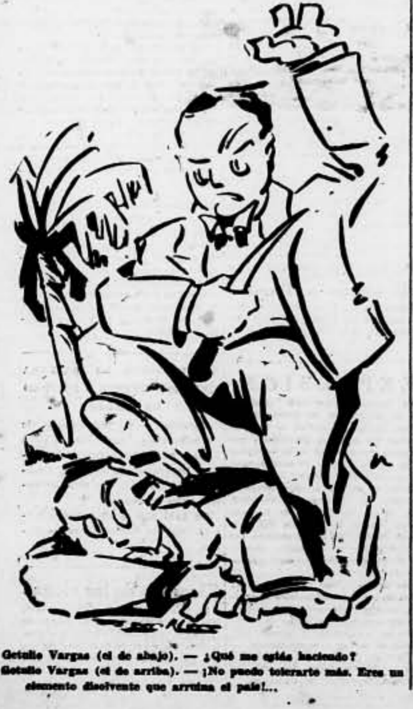
Getulio Vargas (el de abajo). — ¿Qué me está haciendo? Getulio Vargas (el de arriba). — ¡No puedo tolerarte más. Eres un elemento disolvente que arruina al país!..

Belchite.—Intenso fuego de fusil y ametralladora por los sectores de Mediana y Puebla de Albornó. En la madrugada última, el enemigo ha intentado verificar un ataque sobre nuestras posiciones, a la izquierda de Monte Sillero, sin resultado. Ha habido intenso fuego de mortero y cañón y luego lanzó sus fuerzas con extraordinario ímpetu, pero las tropas leales no se inmataron, y tras de permanecer en los parapetos, vigilantes de los movimientos enemigos, abrió copioso fuego de ametralladora y fusil, rechazando plenamente la acometida fasciosa, después de causar grandes pérdidas en las filas atacantes. Durante una hora no cesó el tiro, ya que cada vez que nuestras fuerzas advertían concentraciones en el campo enemigo, disparaba sobre ellas en evitación de nuevos ataques, imponiéndose al fin la calma, que no se ha alterado en el día de hoy, ni aun a la hora de los relevos. Ni lo quiere decir, que de cuando en cuando, no hayan osado las ametralladoras y fusiles. En la montaña, tranquilidad. CARAVANA DE CAMIONES, AMETRALLADA Sarriena.—La aviación repu-