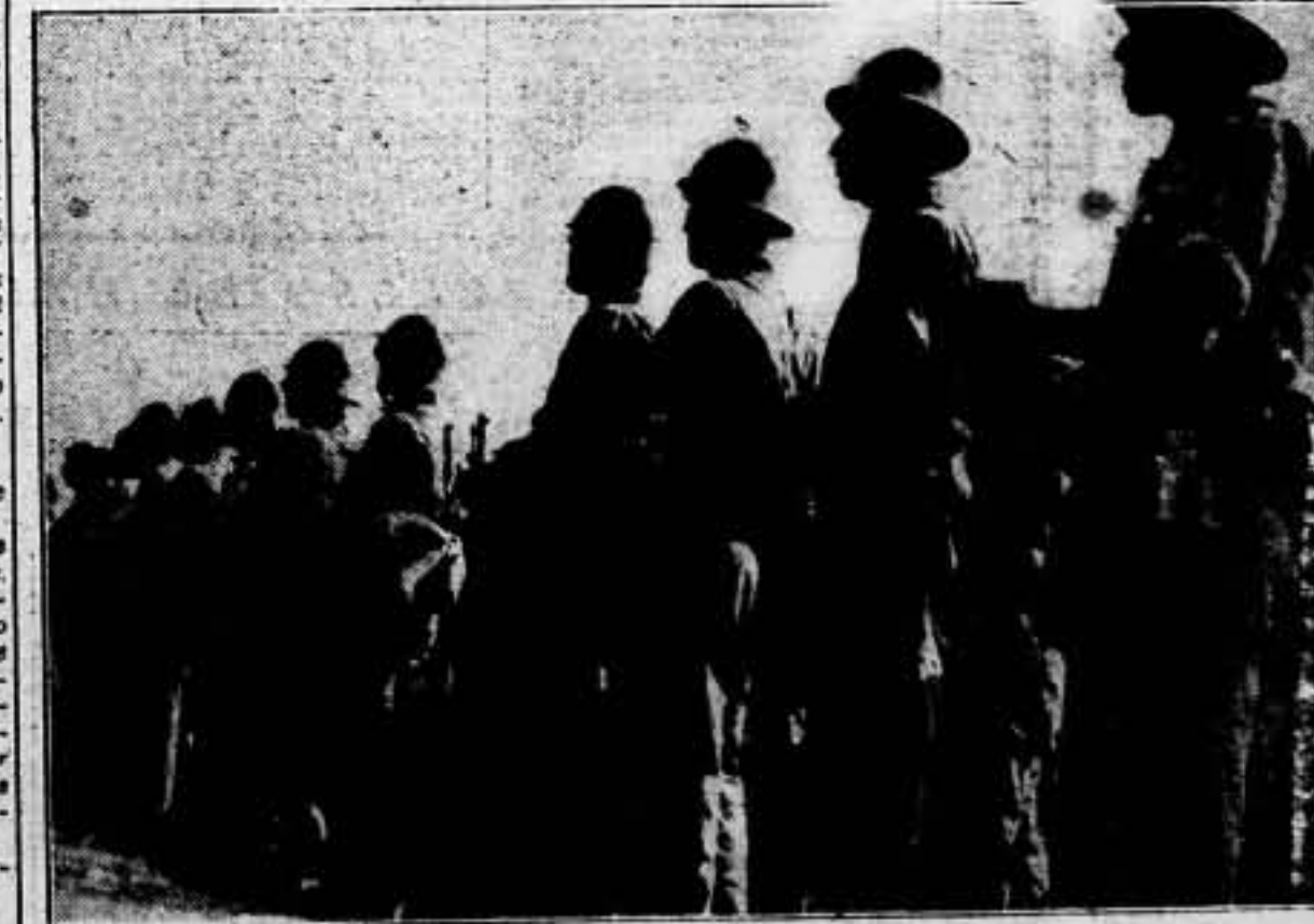
Estos son los soldados del pueblo, los que defienden con el fusil, la independencia de España. Para ellos, ropas de abrigo. ¡Has contribuido ya, lector, a la suscripción que SOLIDARIDAD OBRERA tiene abierta a tal fin

«CATALUNYA» es orgullo de la Prensa proletaria