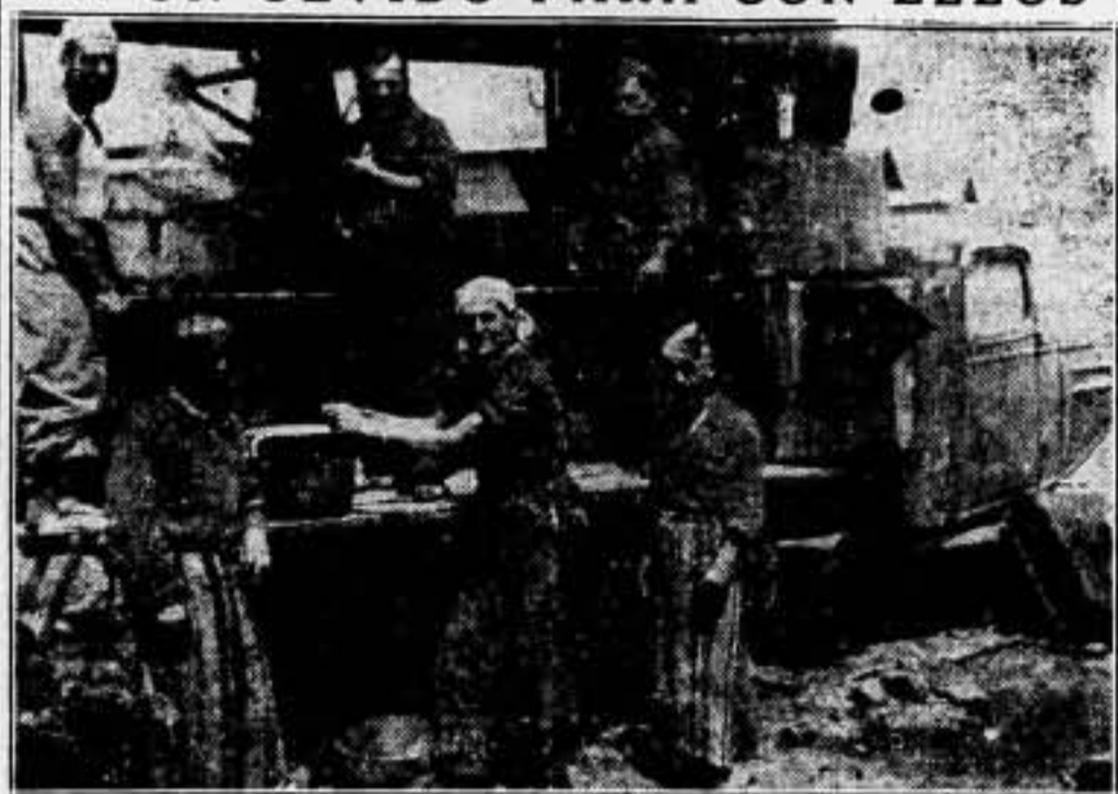
El camarada soldado del pueblo tiene fe y victoria en la victoria final. Por ello, su semblante revela siempre una expresión de alegría. Su alegría es la confianza en un mundo nuevo, forjado con su deber y su sangre. ¿Puede darse el caso, en la retaguardia, de un solo olvido para con ellos?