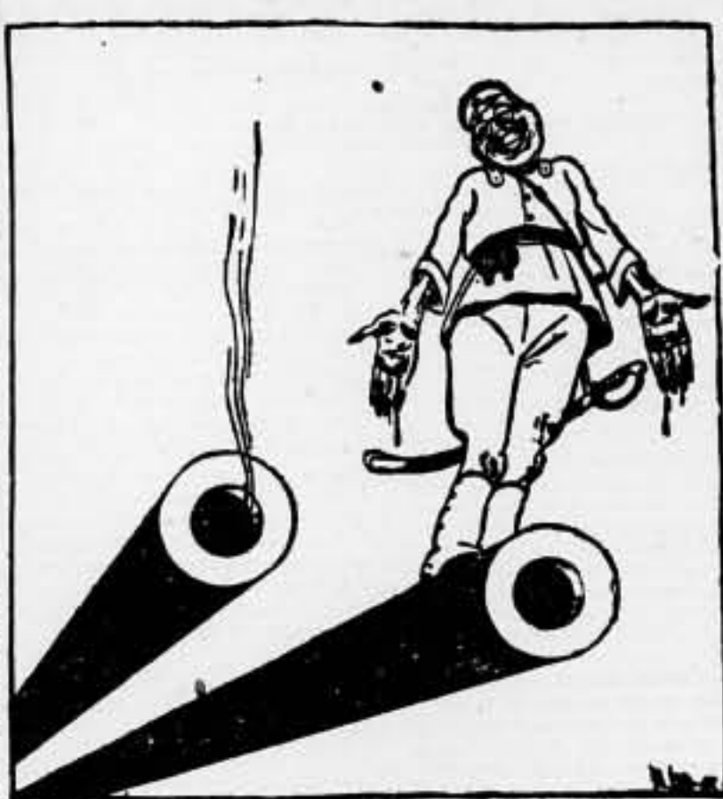
SANGRE EN LAS MANOS. Mientras la farsa de las Conferencias y los acuerdos continúa... (De «Arbetaren», Suecia)