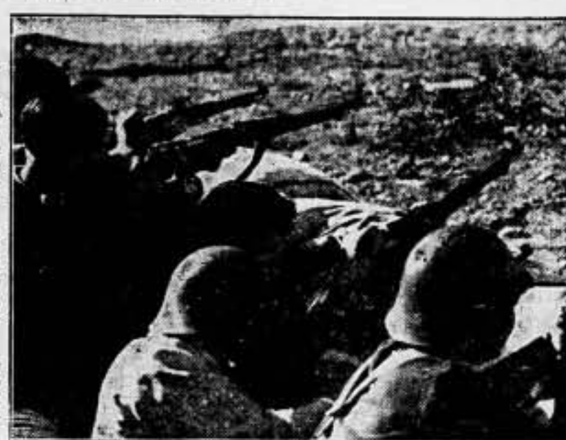
Para que éstos peleen con ardor, se precisa que la retaguardia se mantenga en moral. Ellos son la clave. Y vosotros también, lectores...

OBRA DE LA NO INTERVENCIÓN Más italianos a España