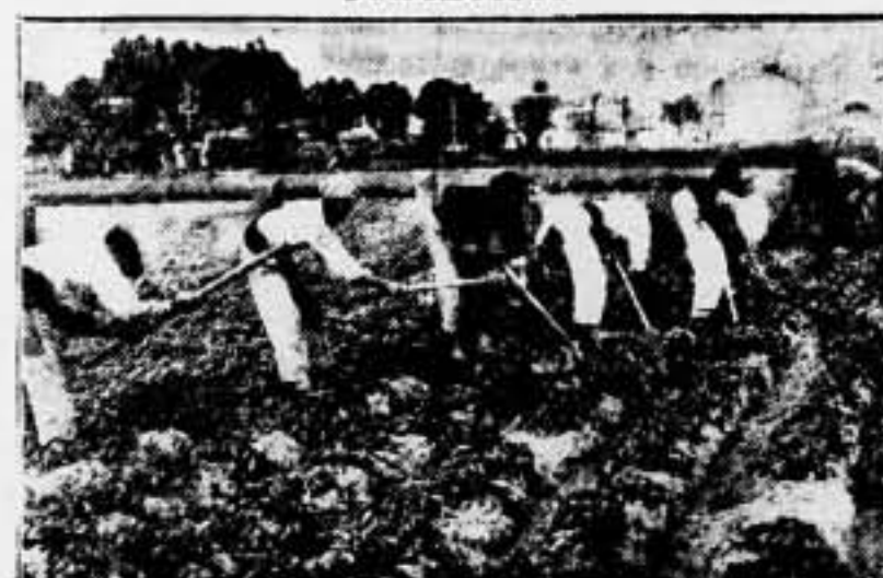
Nuestros camaradas de los campos y las Colectividades, en plena recolección del cacahuet...