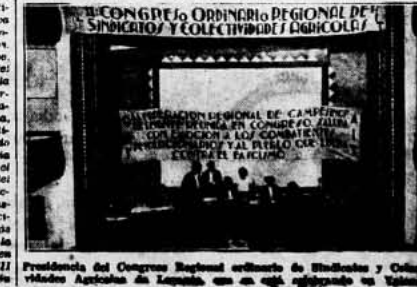
Presidencia del Congreso Regional ordinario de Campesinos y Colectividades Agrícolas de Levante, con un comité organizador en Valencia...