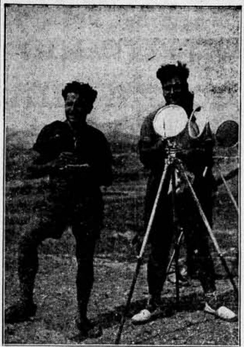
Hace unos meses escason, cumplieron su misión de guerra, en lo alto de la sierra, bajo el sol fuerte del Alto Aragón. Ahora, llegado el invierno...