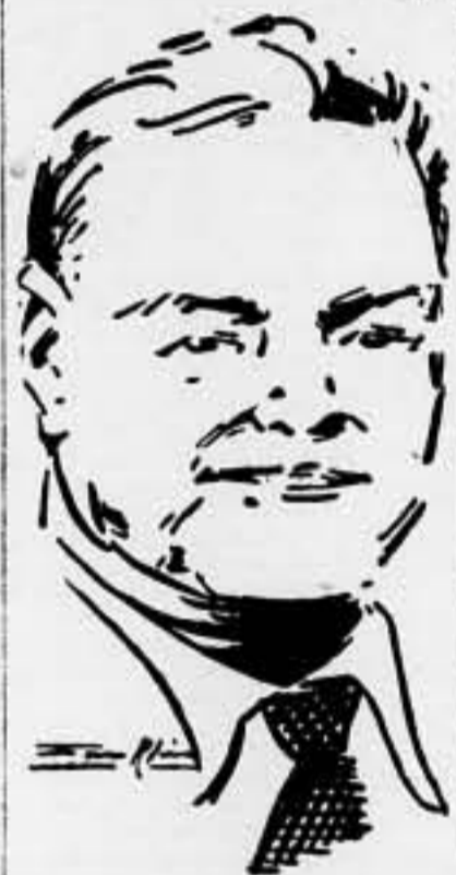
He aquí unas opiniones expuestas por el secretario general del Partido Comunista francés, Mau-