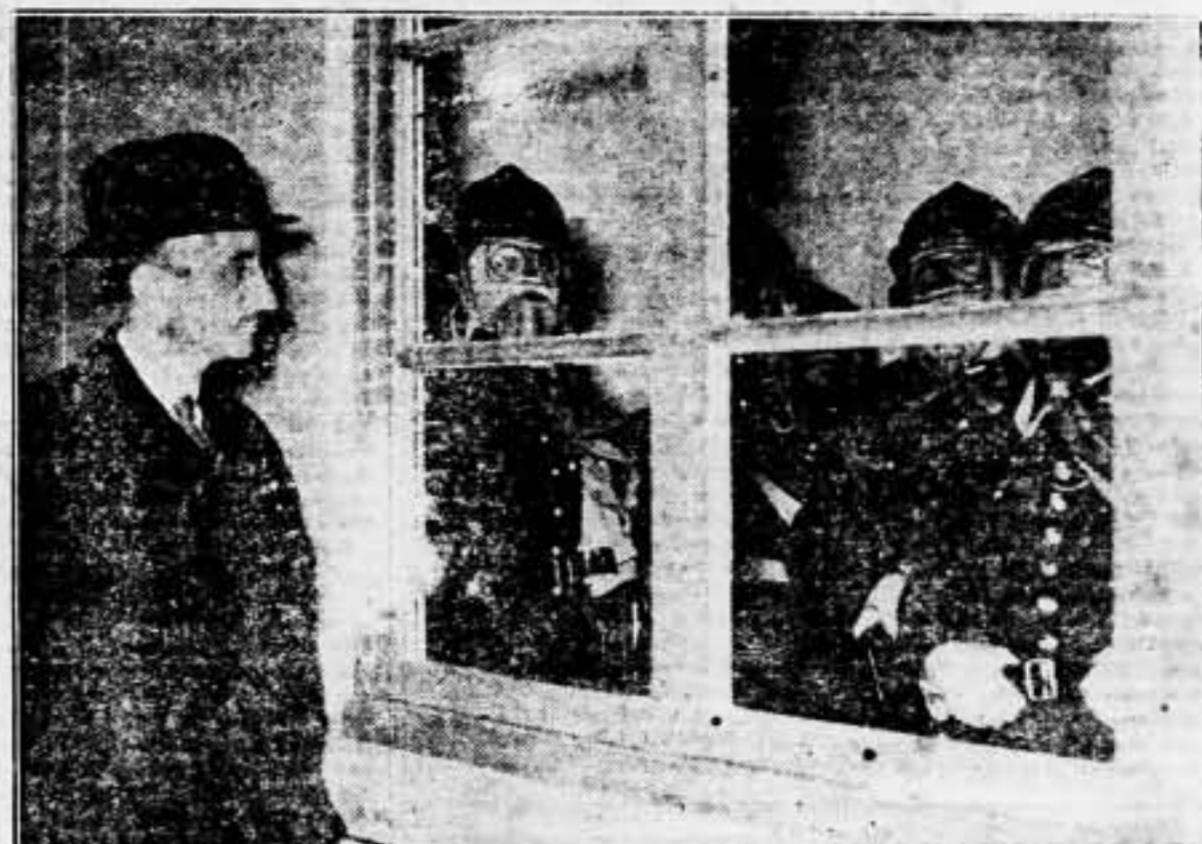
En París se celebró la semana pasada una alarma para experimentar los medios de defensa pasiva antiaérea de la capital francesa. En la foto se ve a M. Langeron, prefecto de Policía de París, observando, a través de una ventana, a unos bomberos con caretas protectoras contra los gases encerrados en una habitación asfixiada por los gases.

PREPARATIVOS CONTRA LA GUERRA QUIMICA EN FRANCIA