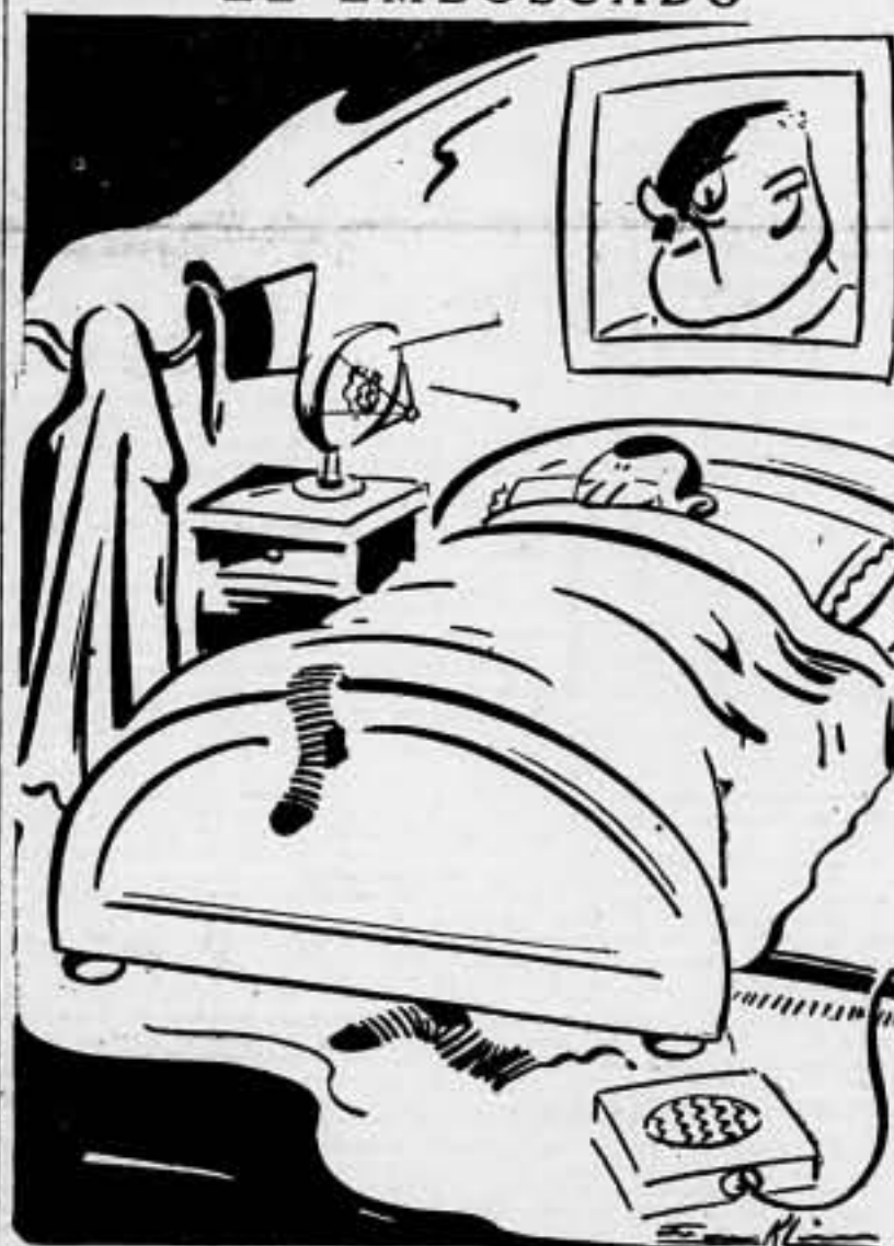
Ya empiezan a pedir mantas para el frente. Si supieran las que yo tengo...