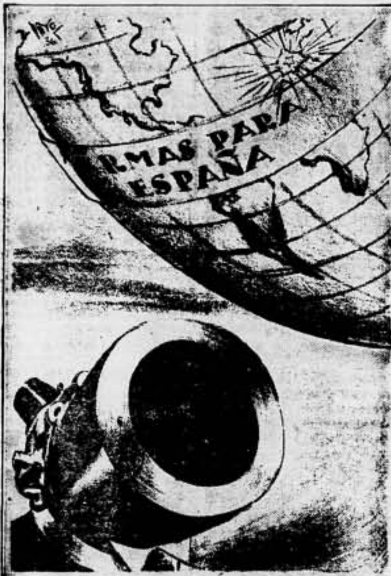
LA CONSIGNA ANTIFASCISTA DEL MUNDO

POR LA REVOLUCION E INDEPENDENCIA DE ESPAÑA