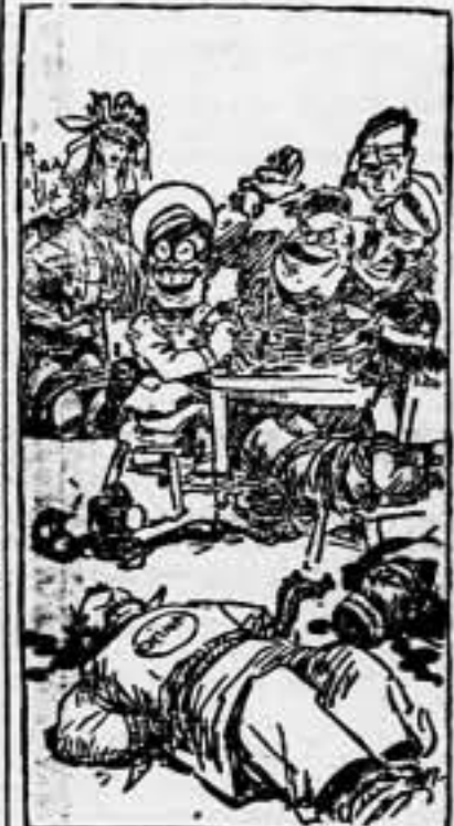
Los bandidos se ríen de las demagogías