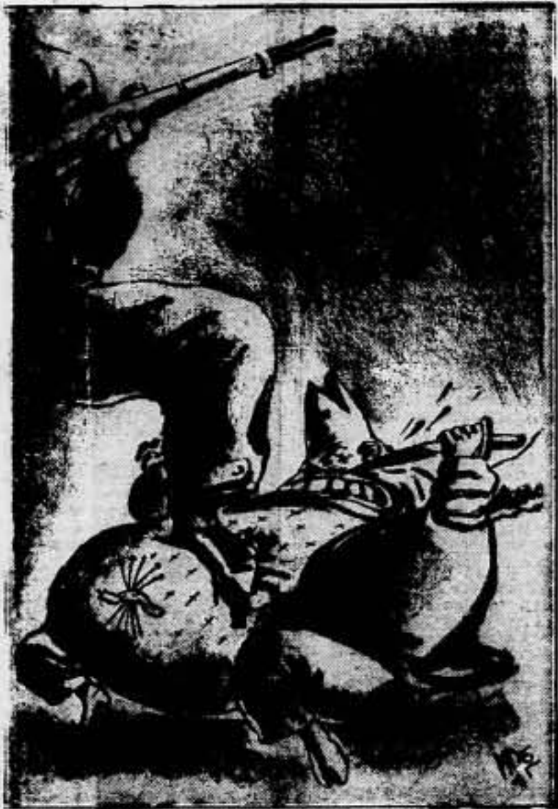
¡Sin piedad! Mientras alentan, son un pollizo.

POR LA REVOLUCION E INDEPENDENCIA DE ESPAÑA