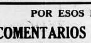
(De La Flecha)

¡Usted querrá dispensar a Halifax; no ha tenido tiempo de cambiarse!