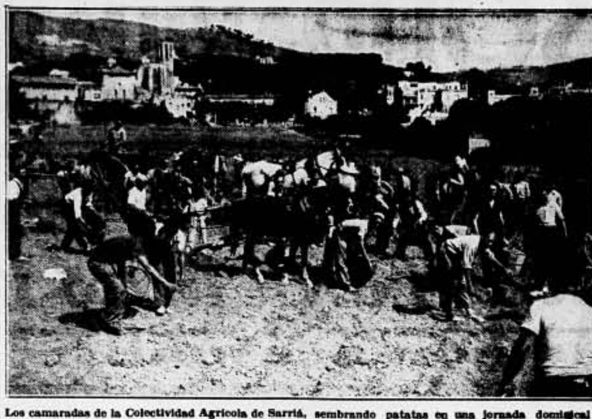
Las camaradas de la Colectividad Agrícola de Sarriá, sembrando patatas en una jornada domingal de trabajo voluntario

El Departamento de Economía de la Ge- neralidad de Cataluña ha visto con extra- ñeza la aparición en un periódico de la