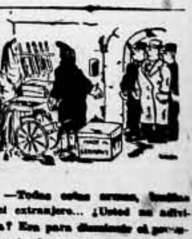
El día: ¡Pero, por lo menos, la mitad!

Más refugios y obtención de todos los elementos defensivos necesarios para la seguridad de la población. De esta manera, aseguraremos una posición en la lucha contra el fascismo.