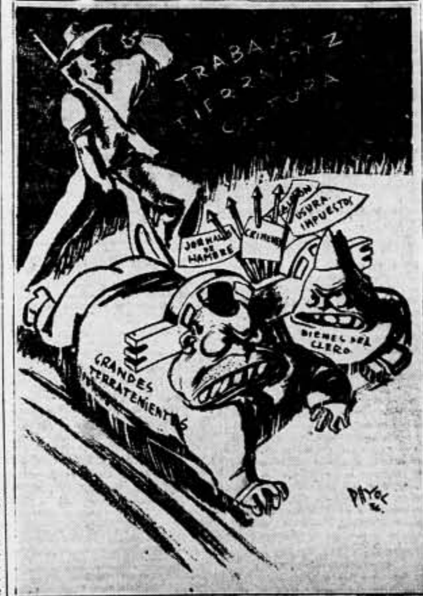
LA FACTURA DE LA REVOLUCION