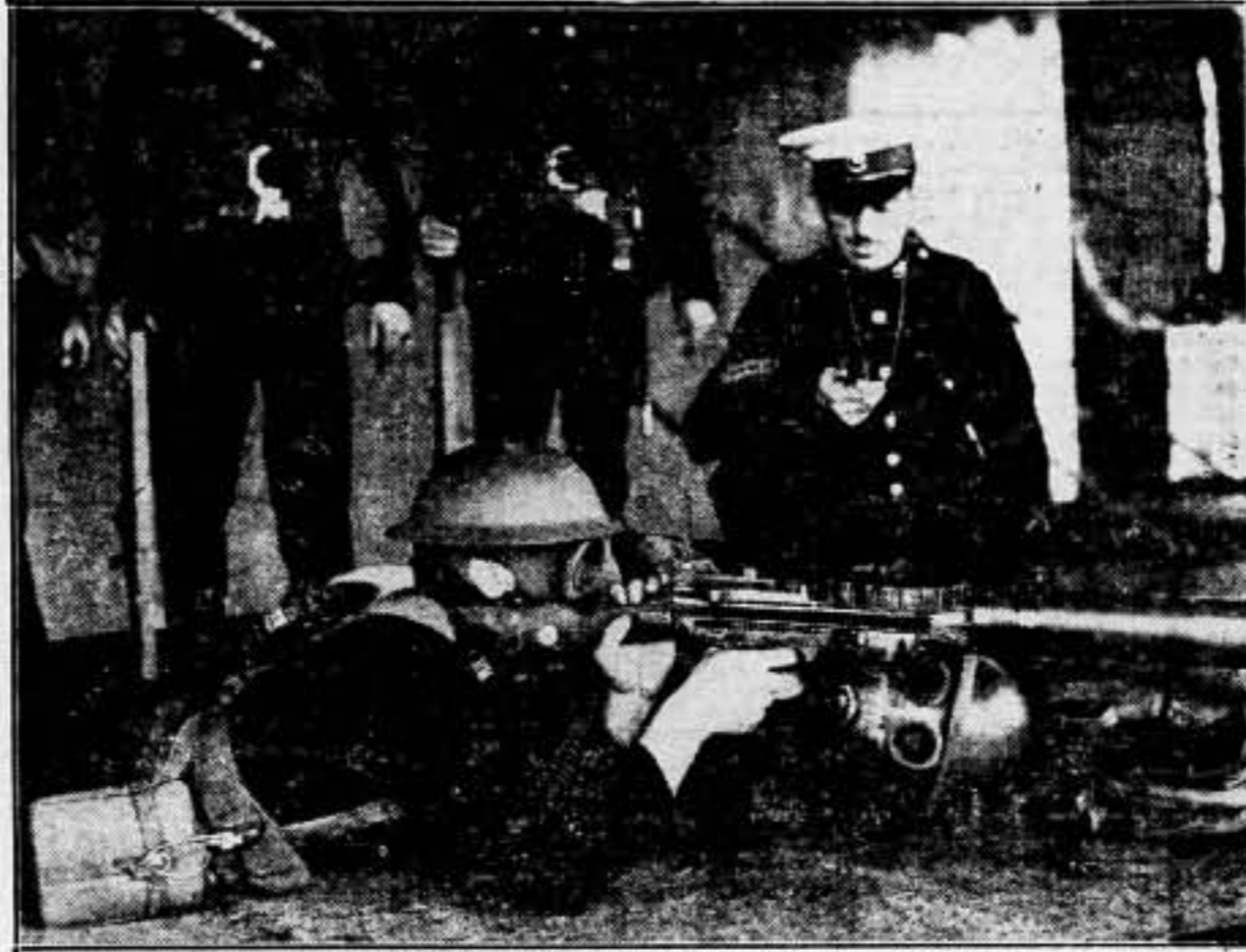
Marinos del portaaviones "Furius", haciendo demostraciones con una ametralladora Lewis, protegidos con caretas antigás