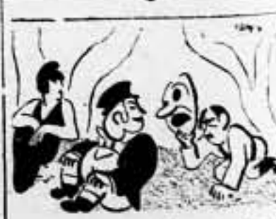
Si no me devolvéis mis colonias os voy a hacer miedo!

Es una pérdida innecesaria de energías y se quite todo aquello que interrumpe el ritmo del trabajo, que debe ser cada vez más vivo e intenso. Podría objetarse que a esta altura de la lucha la propaganda estridente en torno a esta cuestión, resulta un poco chocante. Pero, si se cree necesario hacerla para que se lleve a efecto con mayor amplitud, en buena hora que se haga.