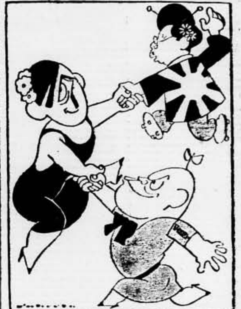
FACTO ANTICOMUNISTA Tres eran, tres, las hijas de Eden; tres eran, tres, y ninguna era buca. (De "La Critica", de Buenos Aires)

FOR UN OCHO LES DEDICA... Y POR EL OTRO LES SALE Londres, 9. — El embajador de Inglaterra en Tokio, señor Craigie, ha presentado una protesta al Gobierno japonés por las detenciones practicadas la semana pasada por los japoneses en el interior de la Concesión Internacional. Se sabe que, después de las detenciones que han motivado esta protesta, se han practicado otras en iguales circunstancias.—Fabra.