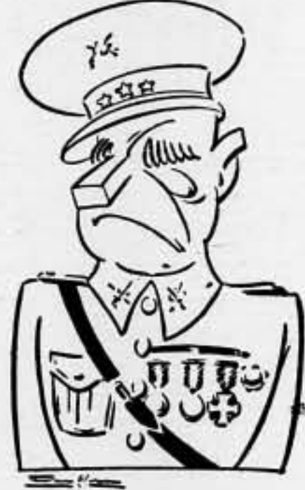
EL MILITAR FANFARRON

Fracasó en Puerto Rico y en La Habana, en Manila, el Joló y en Mindanao; antes, en los dos sitios de Bilbao y siempre que pisó tierra africana.