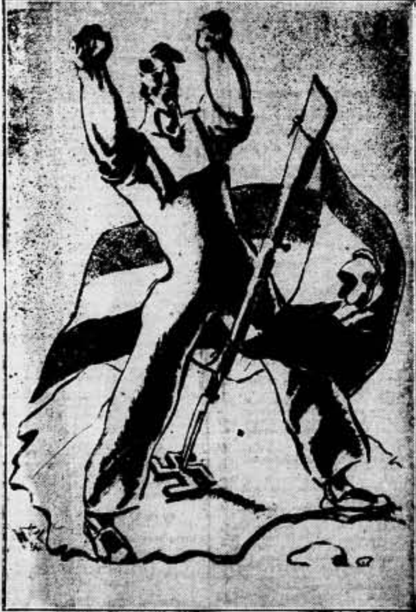
El triunfo del proletariado