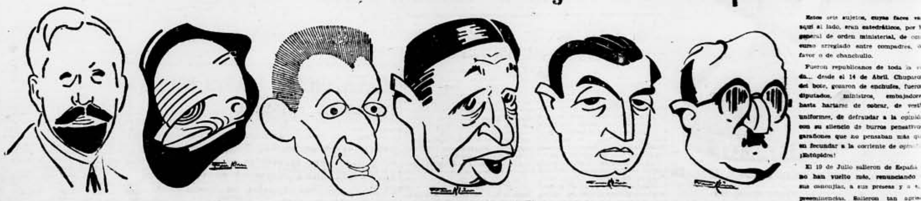
AMERICO CASTRO Es embajador en Alemania. JOSE ORTEGA Y GASSET es Fundador de la Agrupación "Al Servicio de la República". LUIS DE ZULUETA Ex embajador en el Vaticano. AGUSTIN VISUALS Ex ministro de Hacienda. GABRIEL FRANCO Ex ministro de Hacienda. CLAUDIO SANCHEZ ALBORNOZ Es embajador en Portugal.

Estos seis sujetos, cuyos facos van aquí al lado, eran entredichos, por lo general de orden ministerial, de consuno arreglado entre comedias, de favor o de chanchullo. Puaron republicanos de toda la vida... desde el 14 de Abril. Chuparon del bote, gozaron de encharca, fueron diputados, ministros, embajadores hasta hartarse de cobrar, de vestir uniformes, de defraudar a la opinión con su silencio de burros penativos garabatos que no pensaban más que en secundar a la corriente de opinión (Estúpidos). El 19 de Julio salieron de España no han vuelto más, renunciando a sus asonjías, a sus preces y a sus preeminencias. Salieron tan apesadumbrados que perdían la base, hasta el punto que al final de su alacada carrera, se salieron como habrán podido sentirse a reponer.