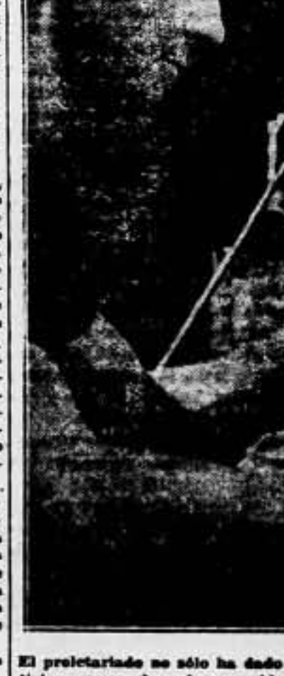
El proletariado no sólo ha dado combatientes. Ha dado, también, artistas, cuyas obras han servido para prestigiar nuestra causa en el frente internacional.