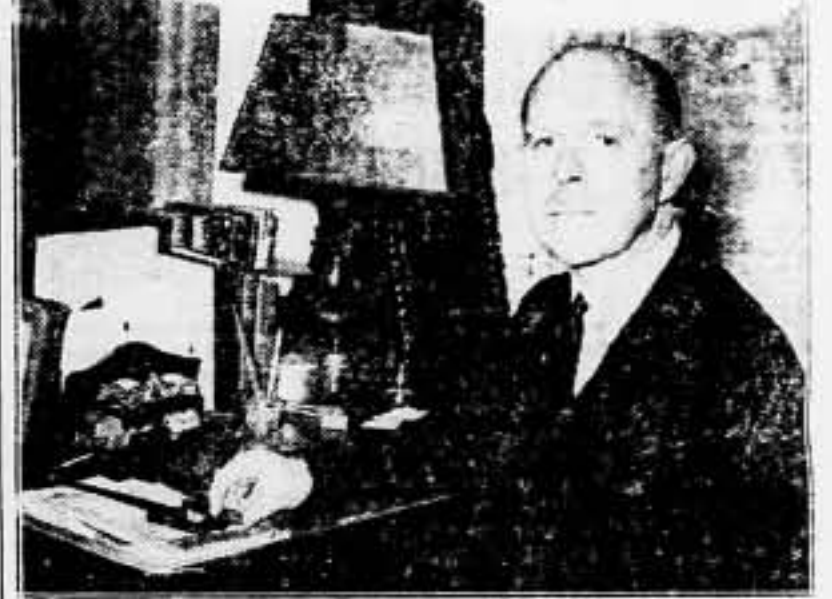
El general mayor Viscon Gort, nuevo jefe del Estado Mayor inglés

Iniciativa de los soldados republicanos, los cuales no han permitido que el enemigo verificara movimiento alguno de fuerzas sin hostilizarlos, adquiriendo los tirotesos mayor intensidad, cuanto más se empeñaban los rebeldes en verificar dichos movimientos.