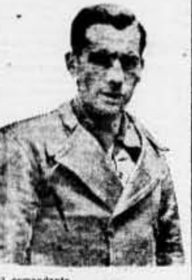
El comandante que realizó las operaciones del asedio a Teruel

El silencio de todo el período de la guerra, apareció ante nosotros, jefe o soldado, en sus ex-