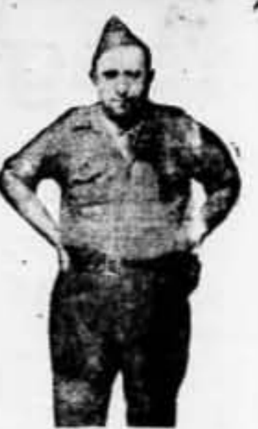
Comandante de Guerra que reconquistó, unido a la División, Teruel para la República

contacto de la 116 con los batallones del cuerpo 18 del ejército de Levante, entrada en la línea de la 118, todo esto resumido los días 17 y 18, a mil quinientos metros de altura de Teruel.