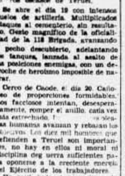
El Comandante que se cubrió de gloria en los combates de la carretera de Teruel a Cortes

aguardando el frío, el viento y la nieve, altísima moral de guerra. Quiéntenos kilómetros cuadrados