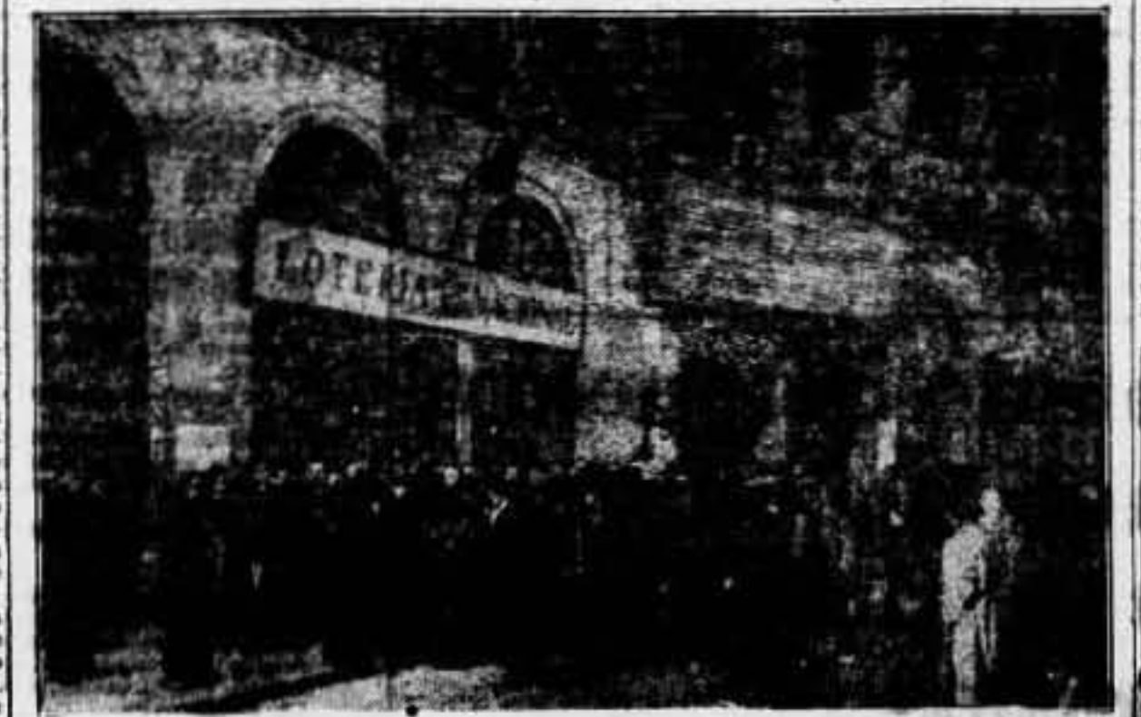
Por vez primera, el sorteo de la lotería se ha realizado en Barcelona. El público, congregado, aguarda en la calle