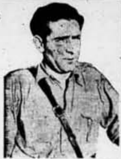
Que desempeña la Jefatura militar de la División, que se cubrió de gloria en los combates de la carretera de Teruel a Cortes