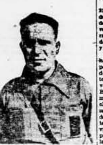
Jefe militar de la Brigada de la División, que estrechó el cerco, y reconquistó a Teruel

contacto de la 116 con los batallones del cuerpo 18 del ejército de Levante, entrada en la línea de la 118, todo esto resumido los días 17 y 18, a mil quinientos metros de altura de Teruel.