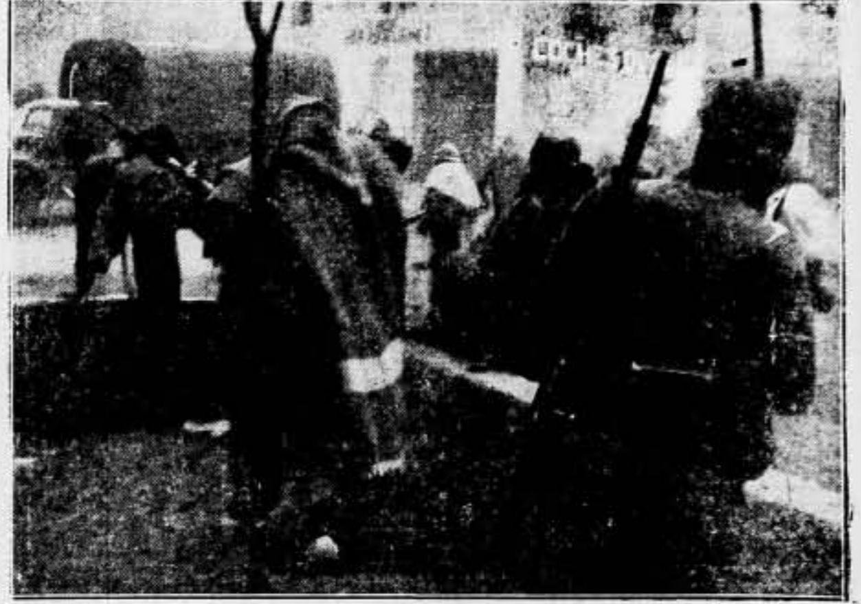
Entre la niebla espesa, perdido ya el fragor del combate, nuestras fuerzas entran tranquilamente en Teruel, despreciando el peligro de los "pacos"