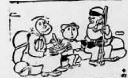
El turolense liberado. Hídez, maña, cuántas ganas que tenía de volver a España! (De "La Hosa")

En un golpe de mano desde nuestras posiciones de la línea exterior, hemos cogido al enemigo ocho prisioneros, veinte mulos, algún armamento y bastantes municiones.