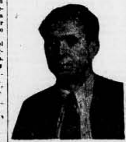
El valeroso militante juvenil libertario secretario del Comité Regional, fallecido indolentemente ayer