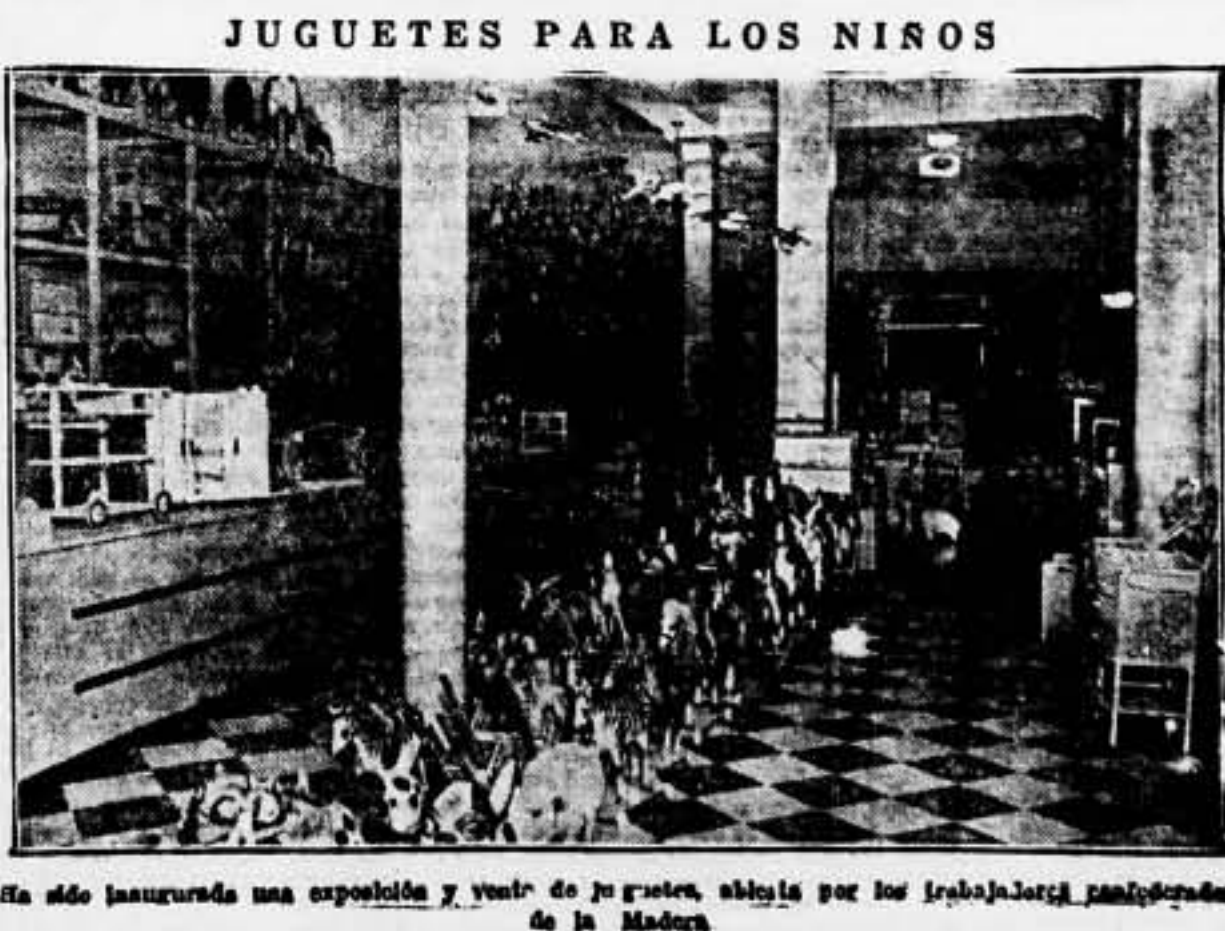
Ha sido inaugurada una exposición y venta de juguetes, abicis por los trabajadores participantes de la Madera