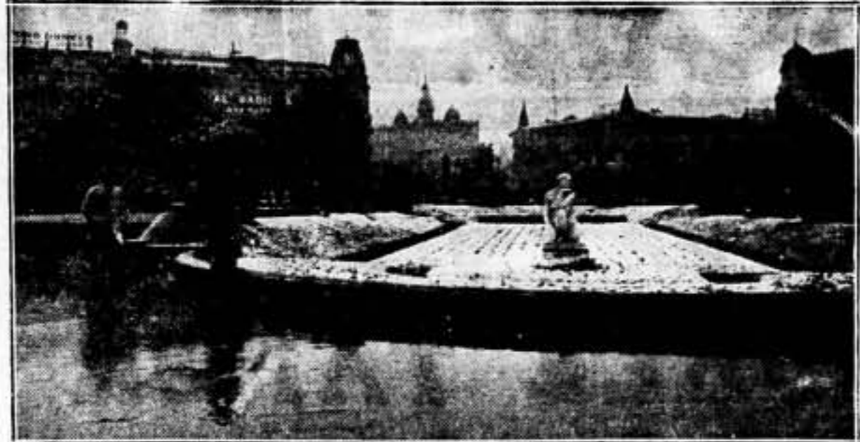
La ventisca helada sorprendió el despertar de los barceloneses. La nieve desmenuzó sus copos sobre los pasos, los jardines y los edificios. Camino del trabajo un solo pensamiento aguijoneó a los proletarios, más que el frío: «ADA, en los frentes».