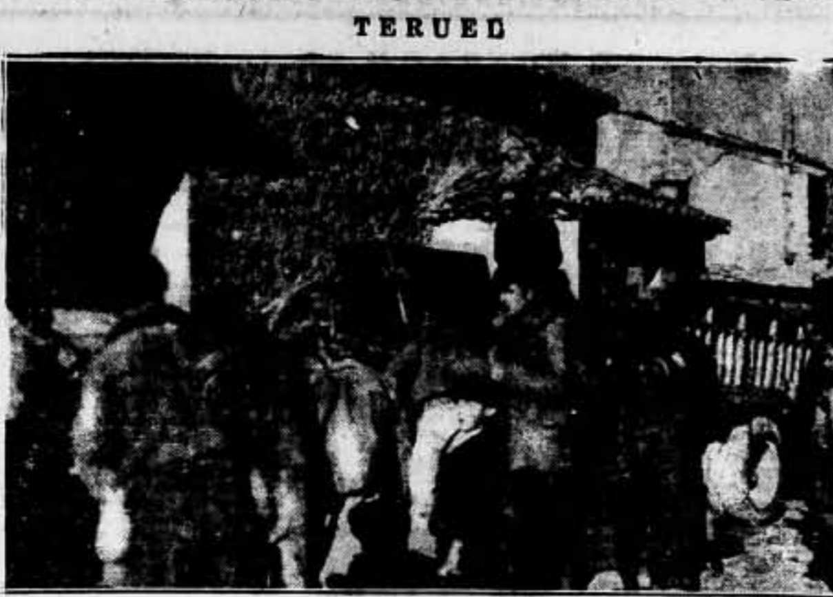
Nuestros valientes soldados subiendo a un camión uno de los cañones cogidos a los facciosos en Teruel