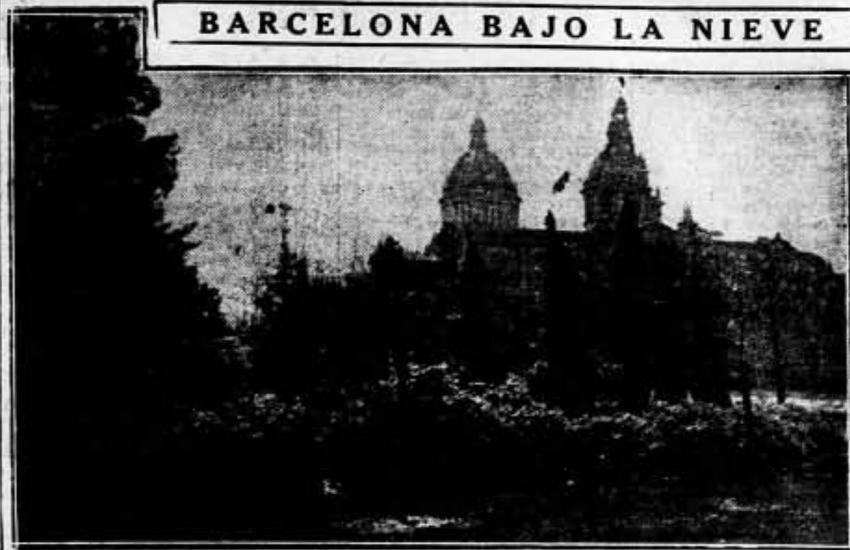
Cercanías de la Exposición, cubiertas por la nieve. Los trabajadores han vivido el espectáculo de la nevada de ayer, con su algo de desafío. El tono grave con que se seguía aquello, decía a las claras dónde estaban sus preocupaciones.