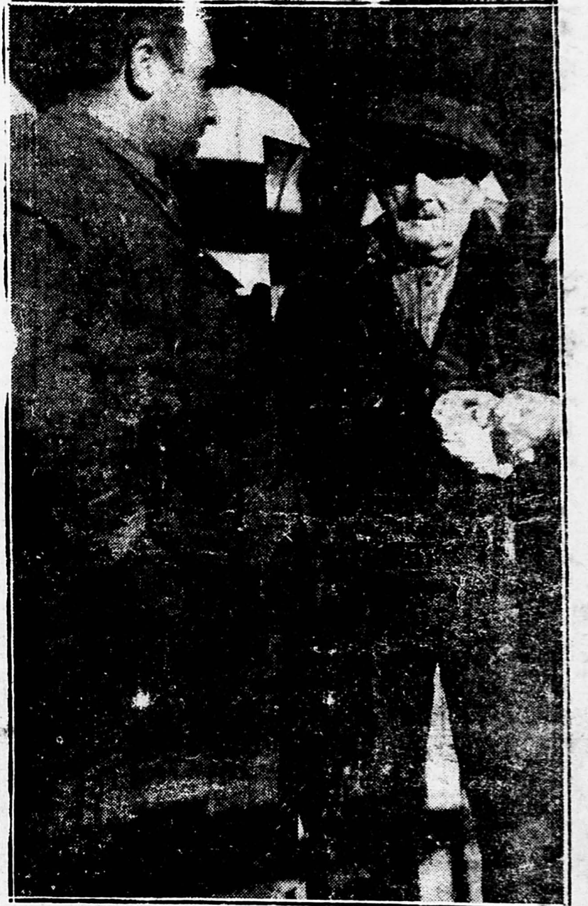
Ejército charla con este viejo de 88 años, superviviente de la guerra carlista, perseguido por Primo de Rivera y prisionero de los facciosos hasta que nuestros compañeros le devolvieron la libertad