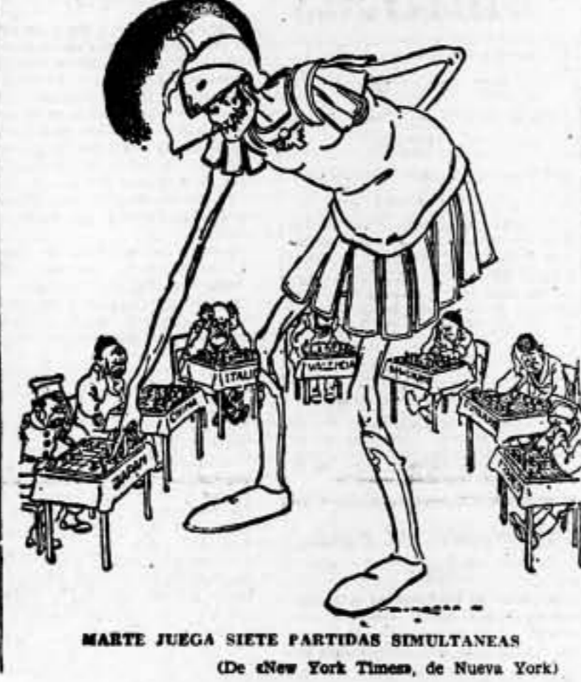
MARTE JUEGA SIETE PARTIDAS SIMULTANEAS (De «New York Times», de Nueva York)