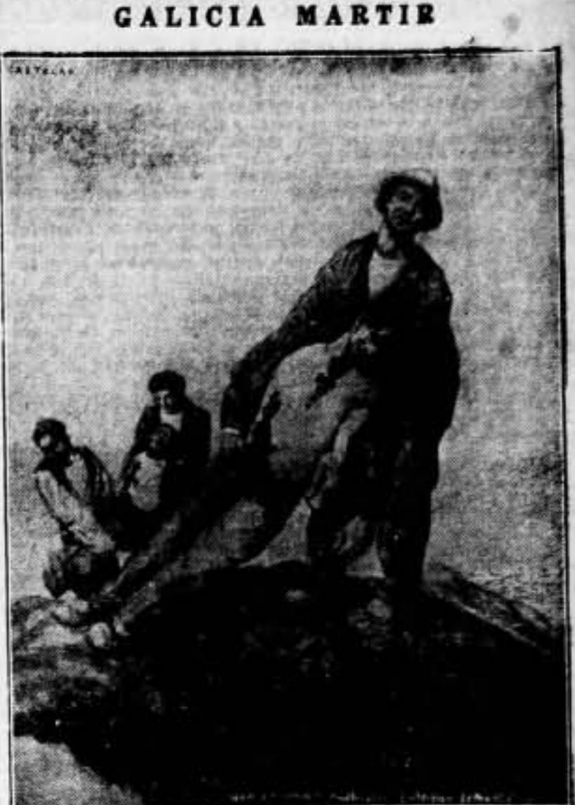
¡No entierran cadáveres; entierran simientes!