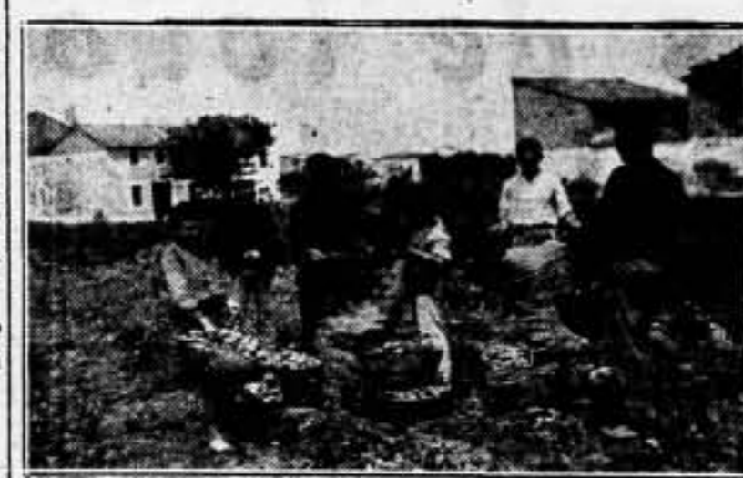
Le recolección agrícola en Hospitalet de Llobregat