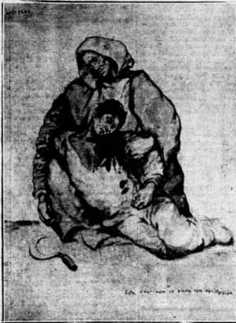
Este dolor no se cura con resignación