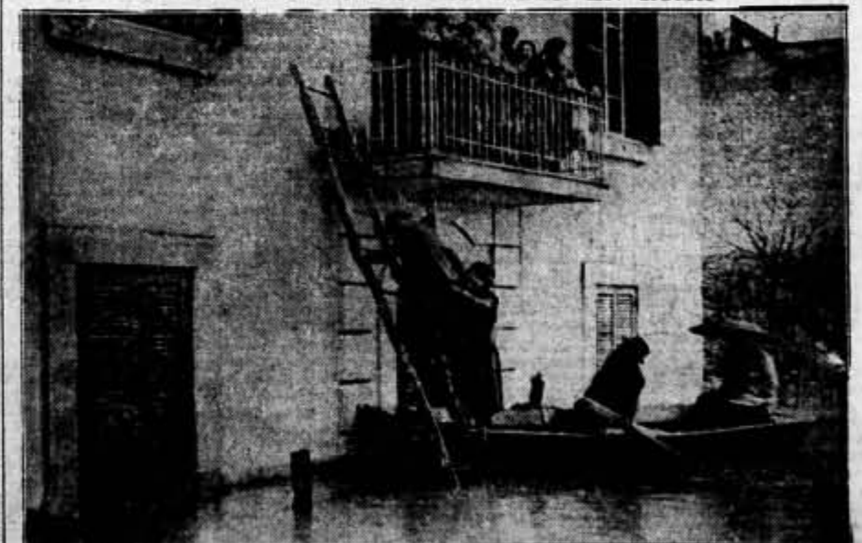
A consecuencia de grandes lluvias, el Tiber ha inundado varios distritos de la capital. En la más fuerte inundación que se registró desde el año 1885.—Una familia salvándose del segundo piso de su vivienda inundada cerca de Roma