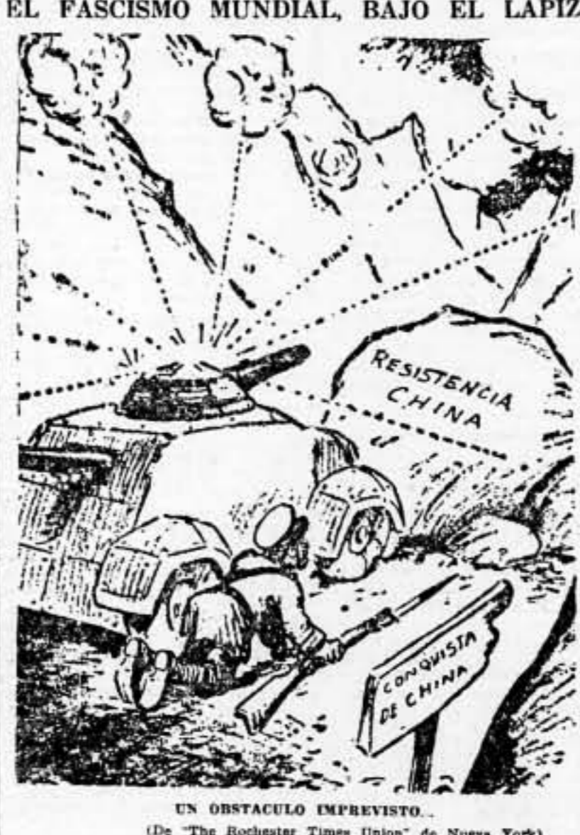
UN OBSTACULO IMPREVISTO. (De 'The Rochester Times Union' de Nueva York)