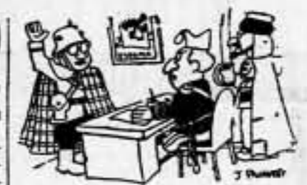
El soldado alemán: ¿Y mi informe sobre el respeto a la integridad del territorio español? —Lo tiene que revisar todavía el gobernador italiano.

Sabe dónde está su deber y cómo cumplirá con su deber. Esto basta. Es una generación con destino de guerra, heroico y dramático; ello la convierte en la conciencia luminosa y revolucionaria de España.