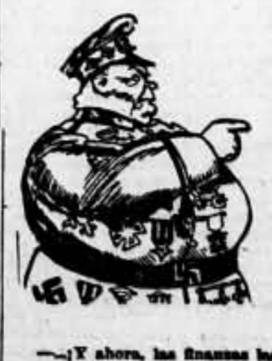
-Y ahora, las Finanzas han metido ya... (De 'The Detroit News', de Detroit)