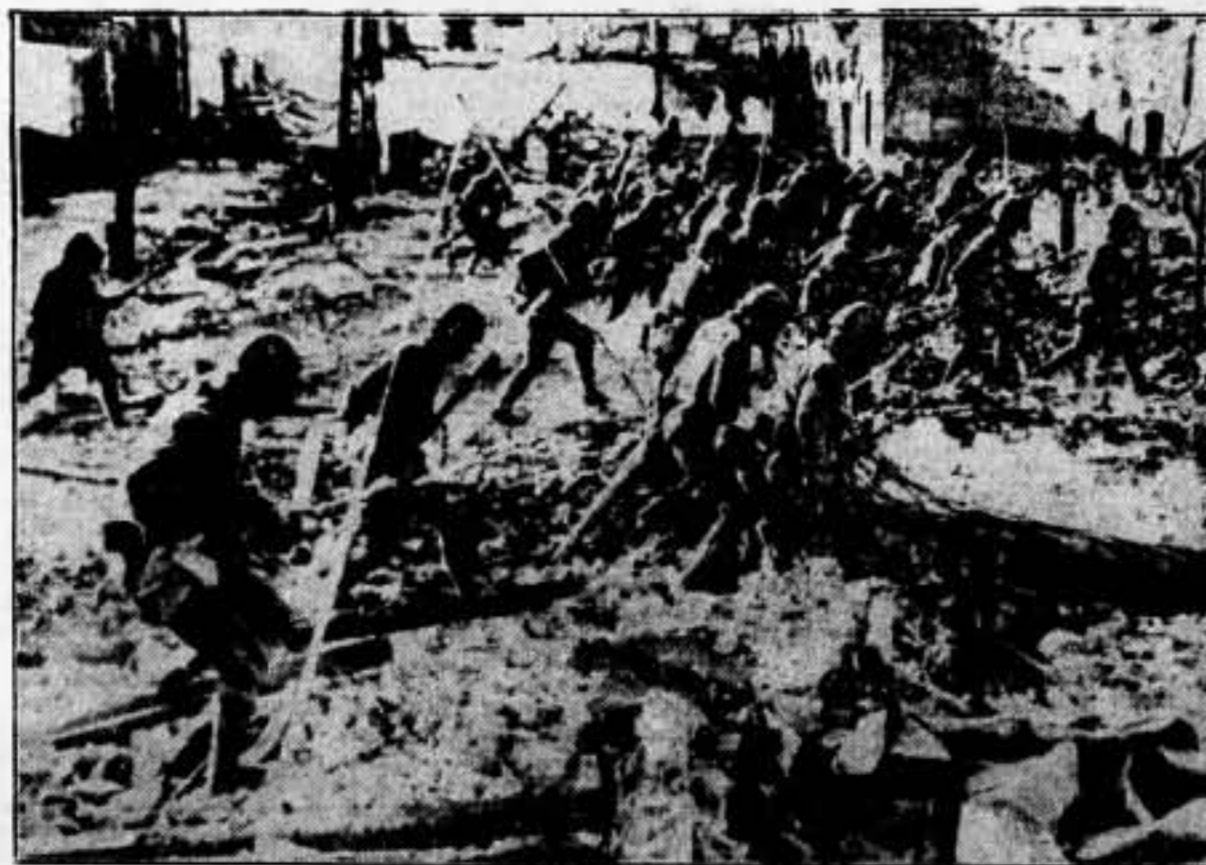
Estas son las primeras fotografías que llegaron por vía aérea a Europa del avance de los invasores japoneses hacia Nankín. Después de una heroica resistencia, las tropas chinas se vieron obligadas de abandonar los suburbios de la ciudad fortificada en el interior. Esta fotografía muestra un pelotón de infantería japonesa saliendo sobre los escombros de una casa en las afueras de Nankín, la cual ha sido hárbaramente bombardeada como se muestra claramente en la fotografía.