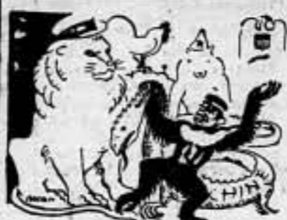
—Y muy en breve, señores, trans. formaré a este dragón en caballo de batalla! (De «La República»)

Londres, 1. — La Legación de Etiopía en esta capital, anuncia que la reina de Holanda ha enviado un telegrama al "Negus", en el cual dice que "el Gobierno no tiene el propósito de proceder a un reconocimiento de jure", sino "de facto". El "Negus" contestó expresando su agradecimiento por que Holanda no reconociera la conquista de Etiopía y por la lealtad con que Holanda aplicó las medidas decididas por la Sociedad de Naciones. "El pueblo etiope no se resignará nunca a someterse a la dominación italiana." — Fabra.