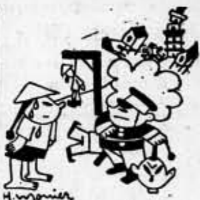
-Le avisa finalmente... Cualquiera revolvía inamigable trasera la ruptura de las relaciones diplomáticas... (De 'Le Populaire')