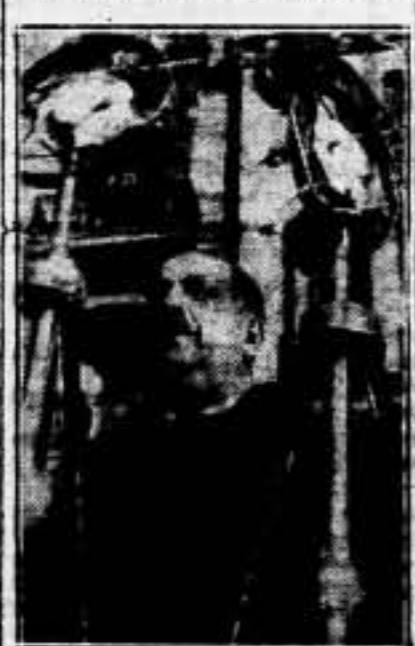
El Pleno ampliado de la U. G. T. se reunió a las cuatro de la tarde bajo la presidencia de Jouhaux.

jetivo de esta reunión es perfilar algunos detalles de la mencionada fórmula.