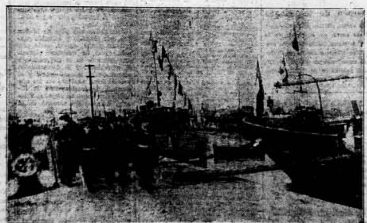
Con motivo del juramento a la bandera de las tripulaciones de la flota búlgara, se celebró la primera gran parada de la Marina de guerra de Bulgaria en Varna, entregada al rey Boris, personalmente, las nuevas banderas a la flota. El rey Boris planeando revista a las unidades navales búlgaras en Varna.