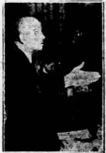
Leon Jouhaux declaró abierta la sesión y pronunció el siguiente discurso:

Valencia, 3. — En la mañana de ayer se reunió el Pleno ampliado de la U. G. T., bajo la presidencia de Leon Jouhaux.