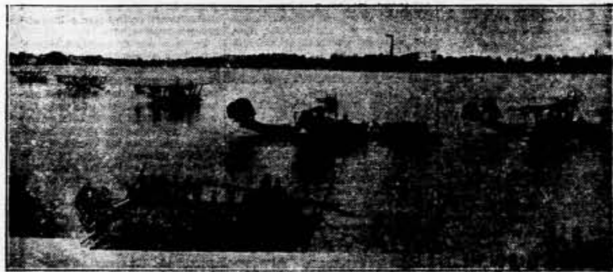
Los cinco hidroscopios del acorazado adm. 204 que cubren recientemente de Inglaterra, destinados para reforzar la base naval inglesa en Calcuta, Bengala e Indopon, cerca de Calcuta. Vista de los hidroscopios después de su aterrizaje sobre el río Hooghly.