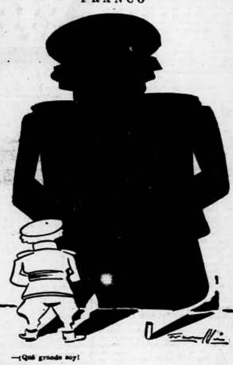
—¡Qué grande soy!