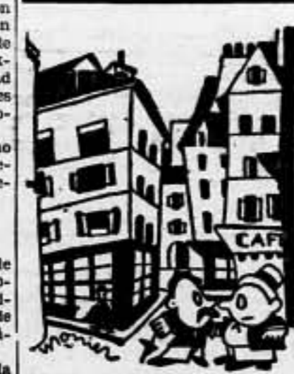
—El eje Roma-Berlin-Tokio-Lisboa-Bucarest-Cairo-Buenos Aires: todo esto me parece ser una serpiente de mar... (De "L'Ouvre")

Un periódico levantino se alaba airado no ha mucho contra el caudillismo de que diversos colegas hacen alarde. De acuerdo con él, nosotros, el caudillismo es una manifestación gregaria, desplazado, por múltiples conceptos, de nuestra actualidad.