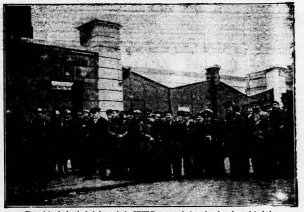
Una vista de los trabajadores de la STURF, esperando la orden de volver al trabajo