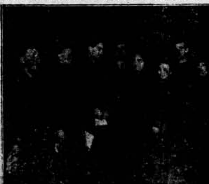
Nuestra compañera Federica Montseny, conversando con los diputados laboristas que han llegado a visitar la España de los trabajadores. Federica tra de la bienvenida.

EL FRIO ARRECIA. LA NIEVE Y EL HIELO SE EXTIENDEN POR LAS TRINCHERAS Y LOS PUEBLOS. ¿Qué haces tú, obrero de la retaguardia, que no contribuyes a la suscripción PRO EJERCITO POPULAR?