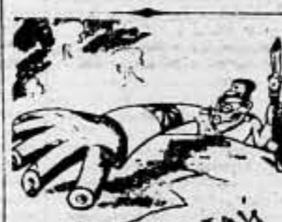
EL JAPON DA UNA MANO (De "Vetchernaya", de Moscú)