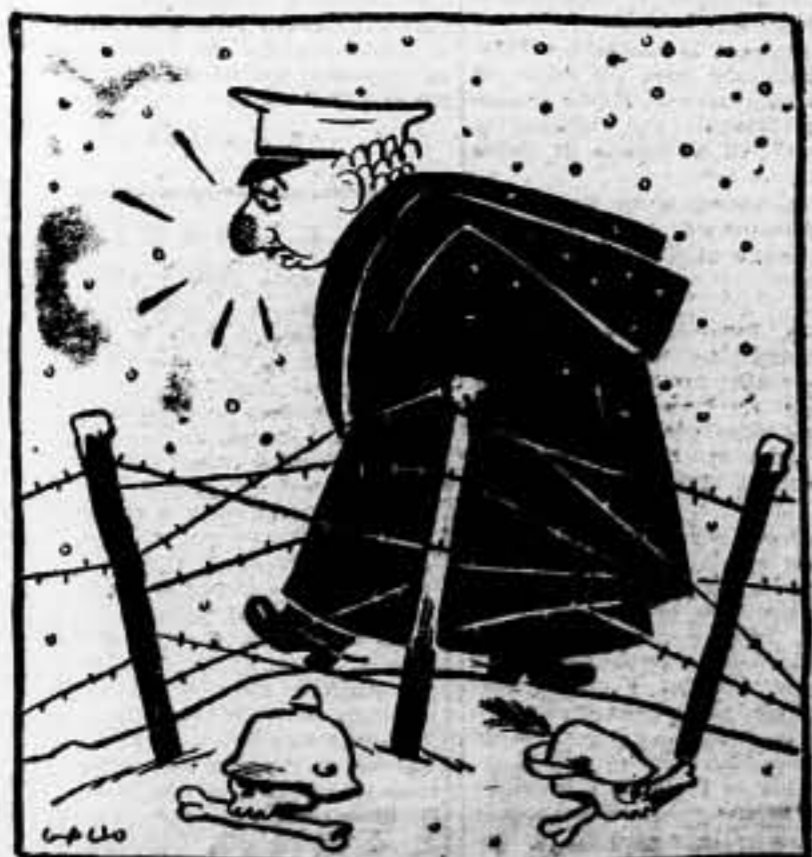
¡Hasta el frío de Teruel me temblaba! ¡Me ha puesto la mara "roja"!

EL FRIO ARRECIA. LA NIEVE Y EL HIELO SE EXTIENDEN POR LAS TRINCHERAS Y LOS PUEBLOS. ¿Qué haces tú, obrero de la retaguardia, que no contribuyes a la suscripción PRO EJERCITO POPULAR?