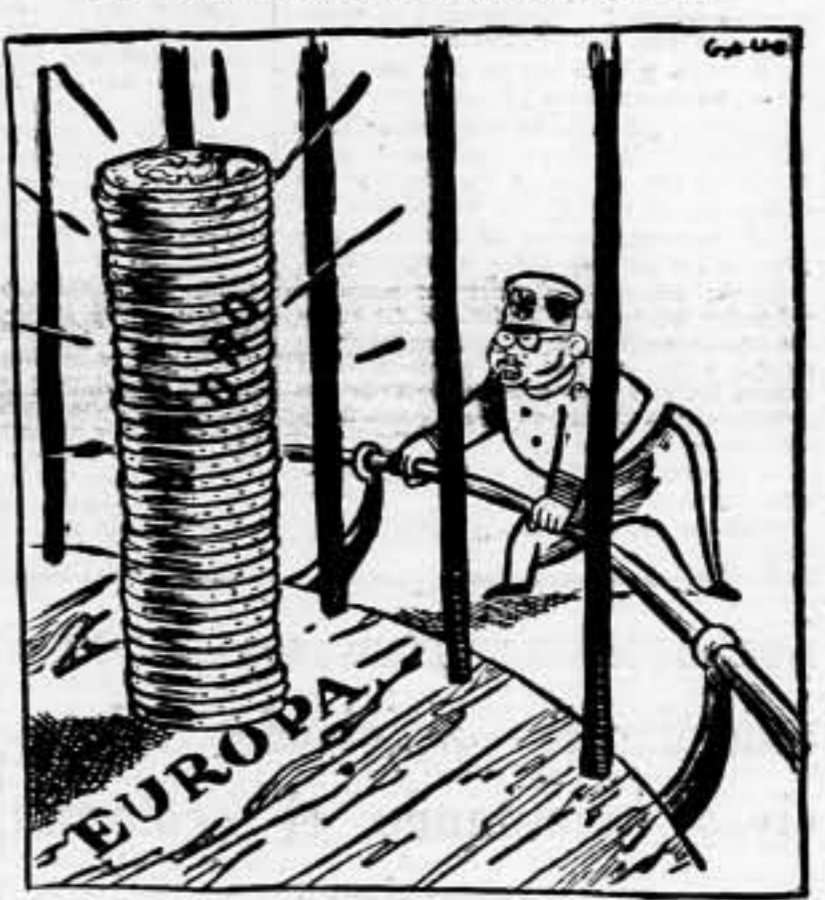
EL JAPON. — Sólo pretendo liberar de la opresión a mi hermano de color: el oro.