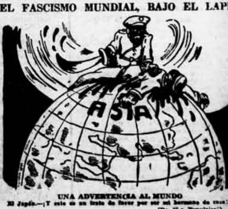
UNA ADVERTENCIA AL MUNDO. El Japón... (De "Le Populaire")

Shanghai, 12. — El embajador de Francia ha protestado ante el embajador japonés, Kawagoe, por el bombardeo aéreo de una misión católica francesa china, hecho en el que resultó muerto un misionero francés y otro gravemente herido. Por otra parte, el comandante de un crucero francés ha protestado ante el jefe de la autoridad naval japonesa por el mismo suceso. — Fabra.