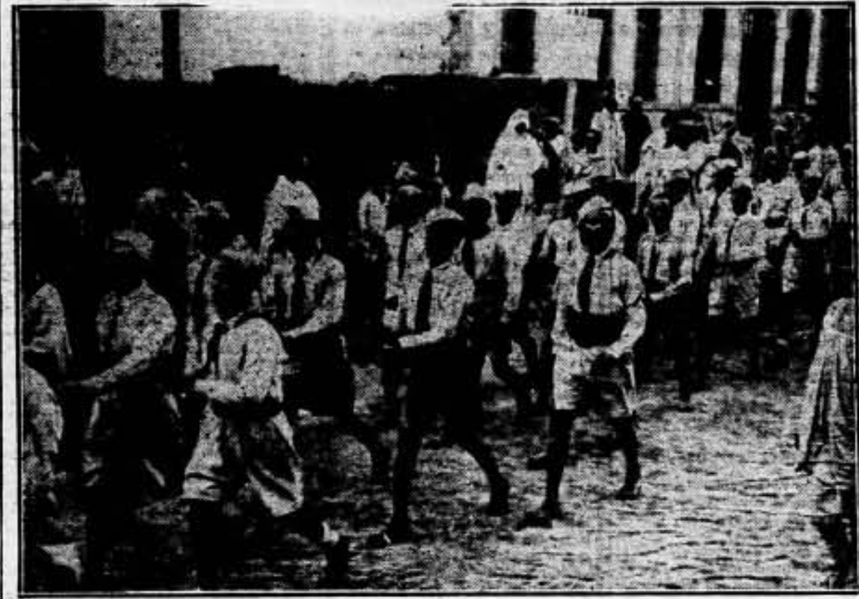
Según el modelo de los "ballias" italianos, el Gobierno italiano ha procedido a la formación y organización de una juventud fascista en Etiopía, que también será instruida militarmente, para un día, tener que luchar contra sus padres e independencia y libertad de su país.—Declaró de "ballias etiopeas" en las calles de Addis Abeba