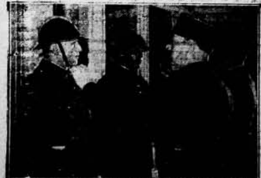
Los agentes de policía de París, han sido dotados últimamente de un nuevo modelo de casco que utilizaban en caso de graves disturbios.