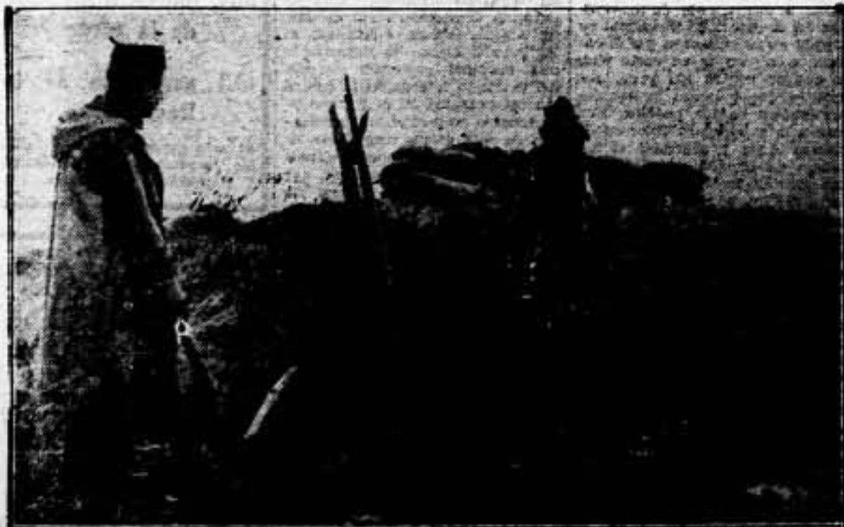
Indiferente al frío y demás inclemencias, nuestro soldado sigue firme al parapeto. (De un periódico catalán)