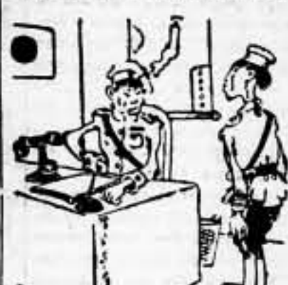
—Un error, mi general. Esta vez mandamos las excusas antes de hundir los barcos... (De "L'Oeuvre")