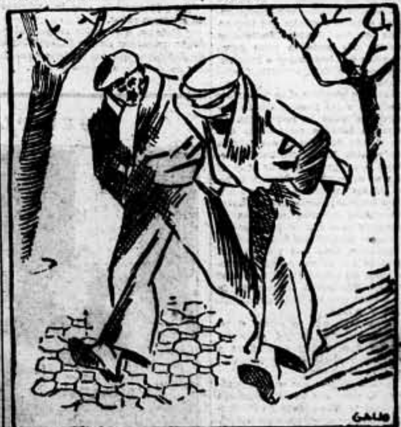
—¿Qué se podría hacer con el obispo que hicimos prisionero en Tormat? — Pues... cuando los "suos" vienen a bombardearnos, distraídos de "objetivo".

Los que carecen de profesión concreta, se dedican a todo, aunque para nada rinden provecho. Su especialidad ya sabes tú cuál es. No creo necesario decirte desde aquí, ni tampoco desde el otro lado, que si crees obrero consciente, da un vistazo ligero a los últimos años, y hallarás la explicación que voluntariamente omito.