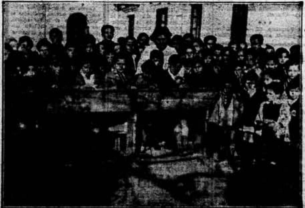
Niños de la Colonia ANCARO - DURRUTI, patrocinada por la S. I. A., donde trabaja el aire libre