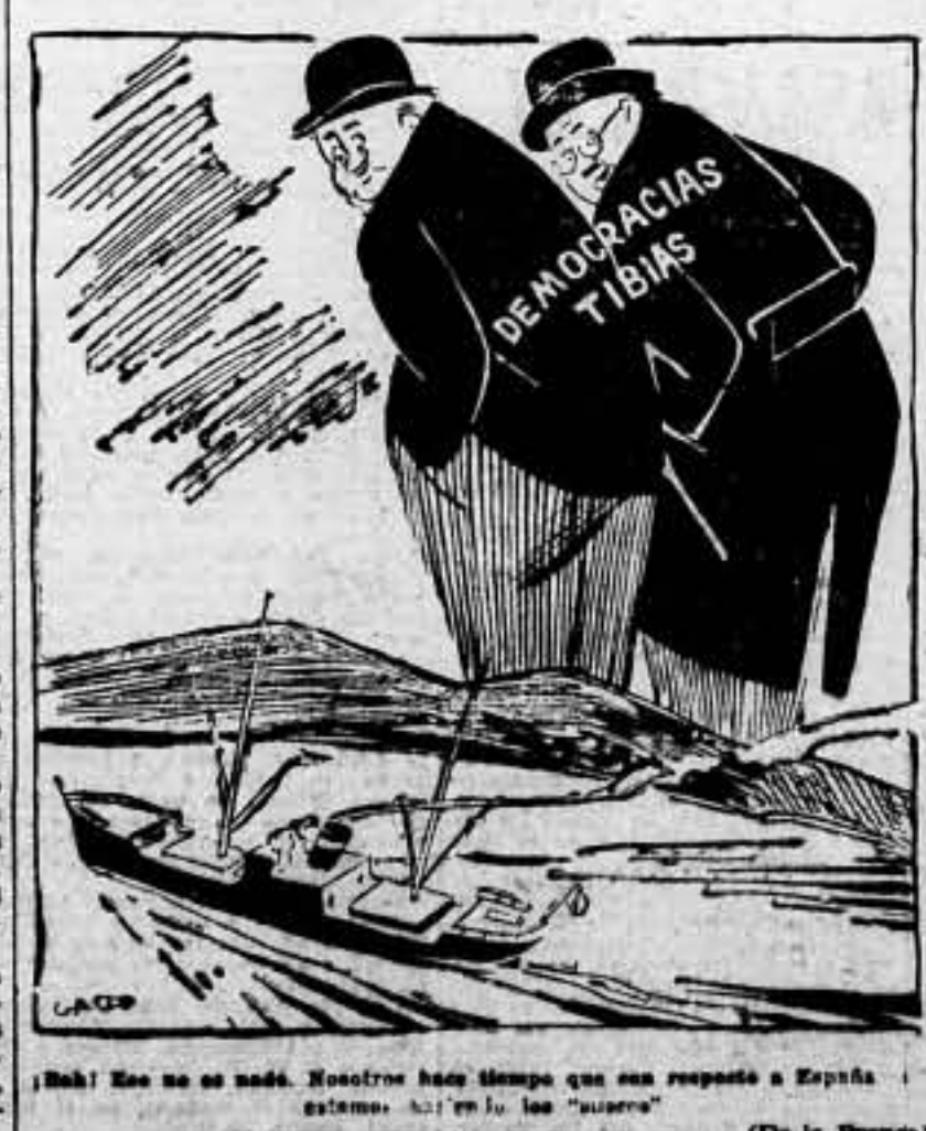
¡Bah! Eso no es nada. Nosotros hace tiempo que con respecto a España estamos así en los «sueros»