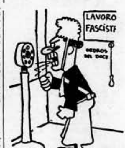
—Empezaremos con una conferencia sobre la "Europa Fascista" y continuaremos con una charla contra las cruzadas ideológicas.

Un fascista chiquitín que se llama Nicolai... Fue al fascista francés... Hitler dióncos le dió y su poder infernal... este niño chiquitín que se llama Nicolai.