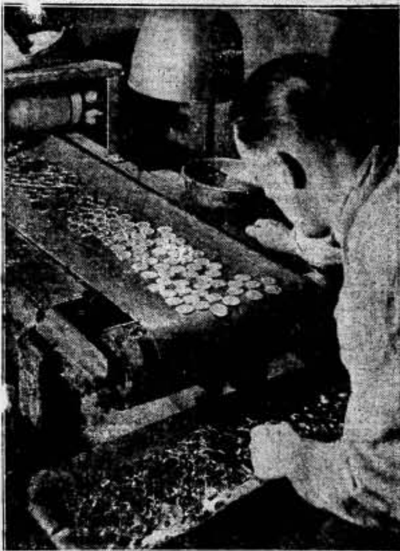
Los empleados de la Real Moneda en Londres, están muy ocupados en acabar las nuevas monedas para 1938, las cuales son muy necesarias. Cada moneda ha de pasar un examen riguroso antes de entrar en circulación. En el fondo se muestran los peniques de 1935, en una cinta de cinta, antes de ser empujados y embalados.