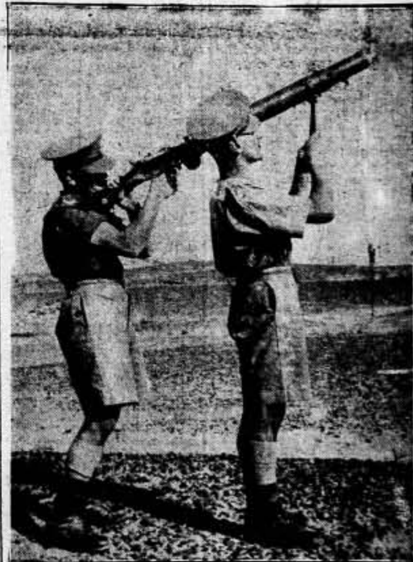
Miembros del Regimiento de Sussex, usando una ametralladora ligera como defensa contra la actividad enemiga durante las maniobras en el desierto.