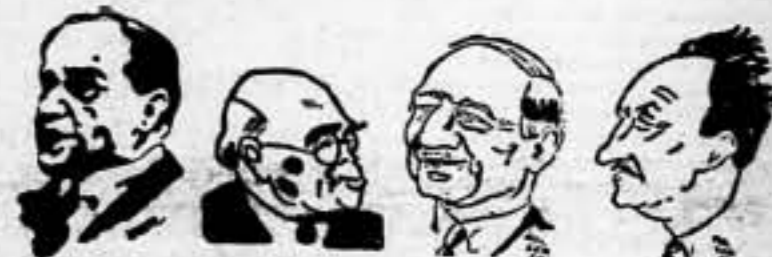
DALADIER SARRAUT DELBOS CHAUTEMPS

Después de la decisión del grupo socialista SFIO, de conceder sus votos al Gobierno Chautemps, éste, en el Hotel Matignon, está procediendo ya al reparto de carteras.