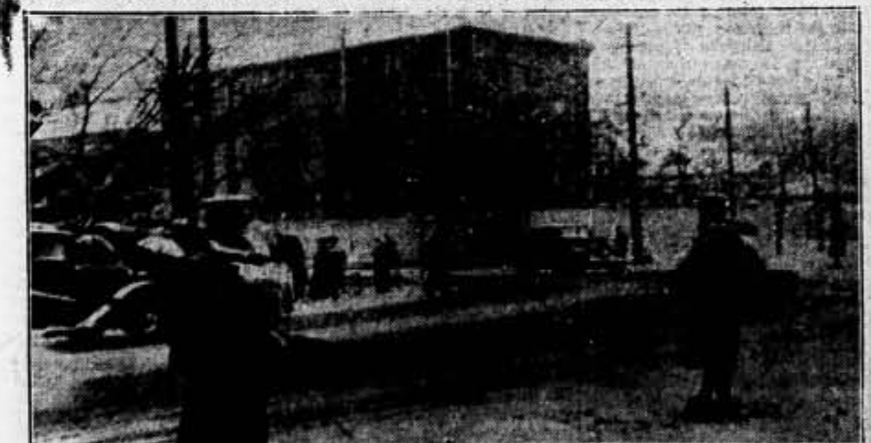
Después de una manifestación que ha tenido lugar en la zona internacional de Shanghai, organizada por los japoneses, varios incidentes entre los habitantes de dicha zona y los japoneses, tendiendo a interrumpir la paz. En esta foto podemos ver a dos soldados que se pasean con la bayoneta colgando vigilando cualquier movimiento sospechoso