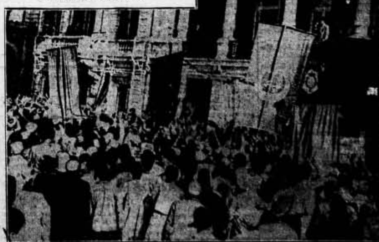
Las manifestaciones del nuevo Gobierno agitan, formado por Mohamed Mohamed Pacha, organizadas una multitudinaria y entusiasta ante el Palacio Real de Alejandría. Durante la manifestación, se registraron varias colisiones entre los partidarios y la Policía, que produjo a los manifestantes del actual Gobierno.