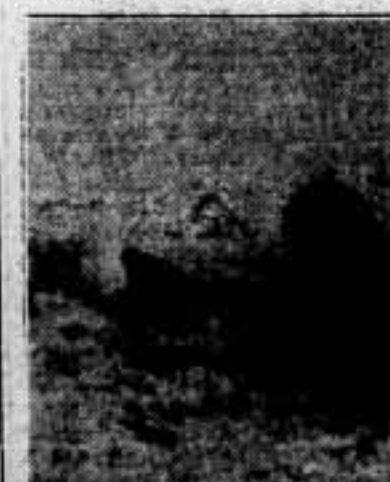
Un día de maniobras hechas en un campo de batalla del Ejército Rojo