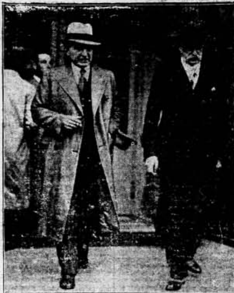
Léon Blum y Daladier, saliendo con Blasco, con motivo de la crisis que está cubriendo a Mussolini