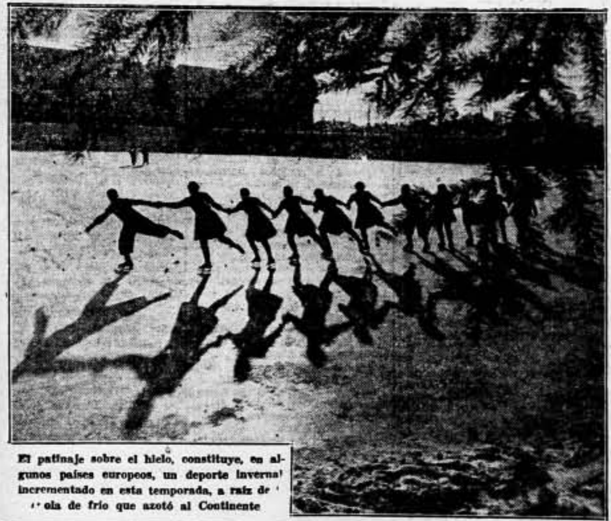
El patinaje sobre el hielo, constituye, en algunos países europeos, un deporte invernal incrementado en esta temporada, a raíz de la ola de frío que azotó al Continente

NUMERO 22 DE Umbral LA GRAN REVISTA GRÁFICA DE LA ESPAÑA ANTIFASCISTA INFORMACION. — REPORTAJES. — CRITICA. — LA GUERRA AL DÍA. — LA CONSTRUCCION REVOLUCIONARIA DEL PROLETARIADO SUMARIO DE ESTE NUMERO Expediente y sorpresa de un viaje aprovechado: Federico Urrea. — Trases del frente, un central: Arsenio Ojeda. — La semana pasada: Luis de Goya. — Una Exposición de Arte. — La vuelta al mundo en cuatro trases, por Gallo. — Balón del Mundo 1º: «Armas, Armas, Armas!», Esquivel Endrix. — Del frente de la guerra, Madrid: Mauro Bajsteria. — La escuela pedagógica de Cataluña: Leizaola Sánchez Barroil. — Perfiles de Aragón, nuevos bohemes del cine: Samuel del Pardo. — Asesinado: Miguel Alonso Romero. — Miembros y pasiones que cotiza a nuestro lado: Ben-ERIMO. — Partes de Aragón, la recolección de la coctana: Samuel del Pardo. — Pintura: J. Berris Casanova; Jass. — Continuación de la novela «No pasará»: Utopía Social. — Informaciones fotográficas de actualidad: Dibujo de Viejo, Lobo, Horna. Fotos de Kati, Pérez de Rosas, Domingo Antonio, Vidal, Vidal Corella, Santos Tubero, etc. LEED ESTE INTERESANTE NUMERO DE LA GRAN REVISTA «UMBRAL». — Oponeo ediciones en toda España