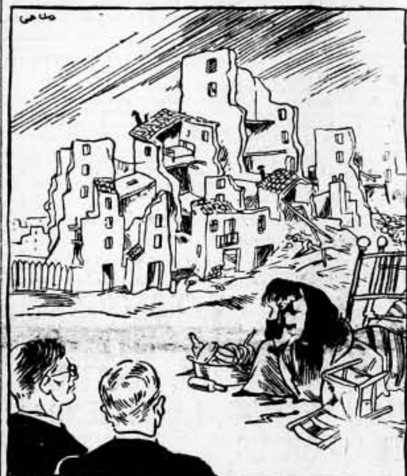
—¡Que paradoja! Visitando España, es como mejor se conoce a Italia y a Alemania.