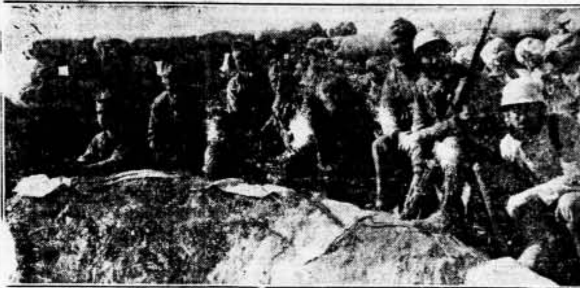
Un minuto de descanso en la línea de fuego. Nuestros soldados posan para SOLIDARIDAD OBRERA.

Por su parte, el comandante del sector, les hizo ver que el Ejército está perfectamente dotado, no obstante lo cual aceptaban, gustosos, la gentileza de los visitantes de enviar obsequios para las tropas.