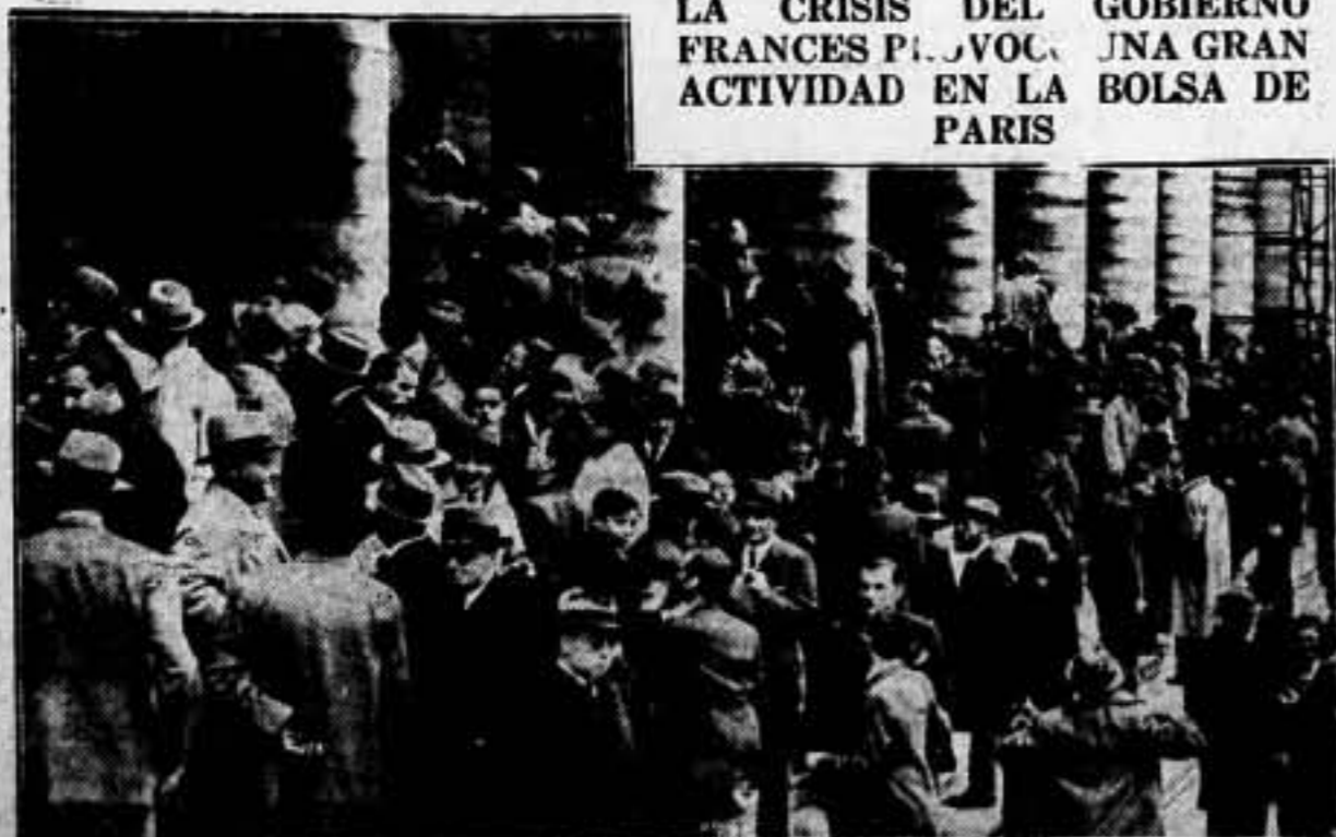
Desde los días que duró la crisis del Gobierno francés, se veía una gran efervescencia en la Bolsa de París, con motivo de la baja del franco.