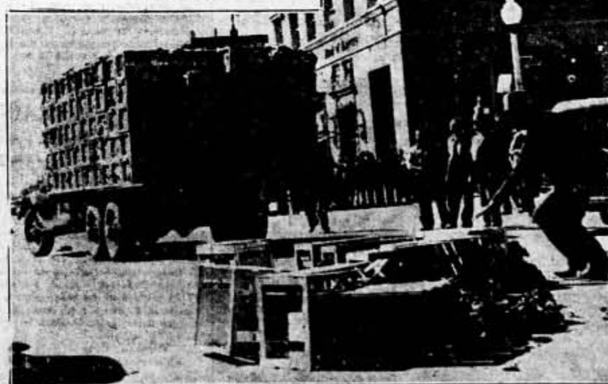
En la región de Salinas (California), se han producido incidentes graves con motivo de la huelga de los productores de lechugas. En esta "foto", se puede ver cómo los huelguistas tiran al suelo un camión cargado con lechugas, ante la llegada de la Policía.