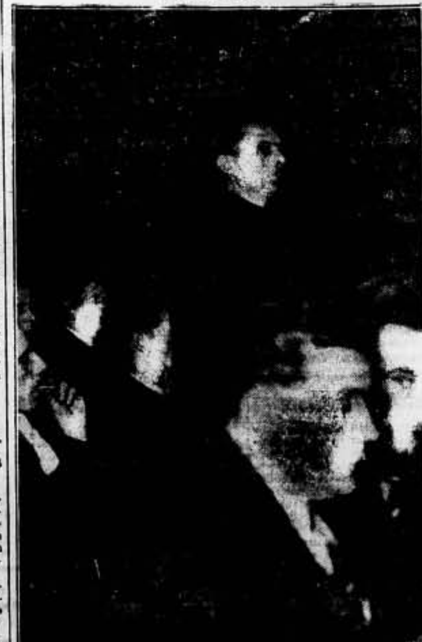
Madrid, por voz del delegado de la Federación Local de Sindicatos, intervienen en los debates del comité nacional.

En la sesión de la tarde, se abre vivo debate sobre el dictamen del COMITE NACIONAL SEÑALA LOS ALCANCES DEL MISMO EN LA ESTRUCTURACION SINDICAL, INDUSTRIAL Y CAMPESINA