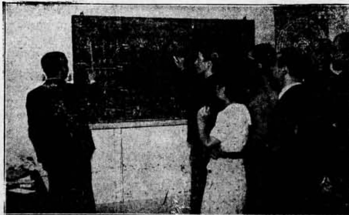
En los cursillos de la Escuela Agraria, los camaradas especializados realizan, junto a los campesinos, una valiosa labor de emancipación cultural

Esta Escuela se piensa establecer en Moncada, para cuyo fin se tiene ya escogido el terreno. En ella los alumnos trabajarán teóricamente y prácticamente, siendo un año la duración de los estudios, durante el cual correrán también a cargo de la Federación los gastos que se originen, como son los de la manutención, alojamiento y sueldo del profesorado.