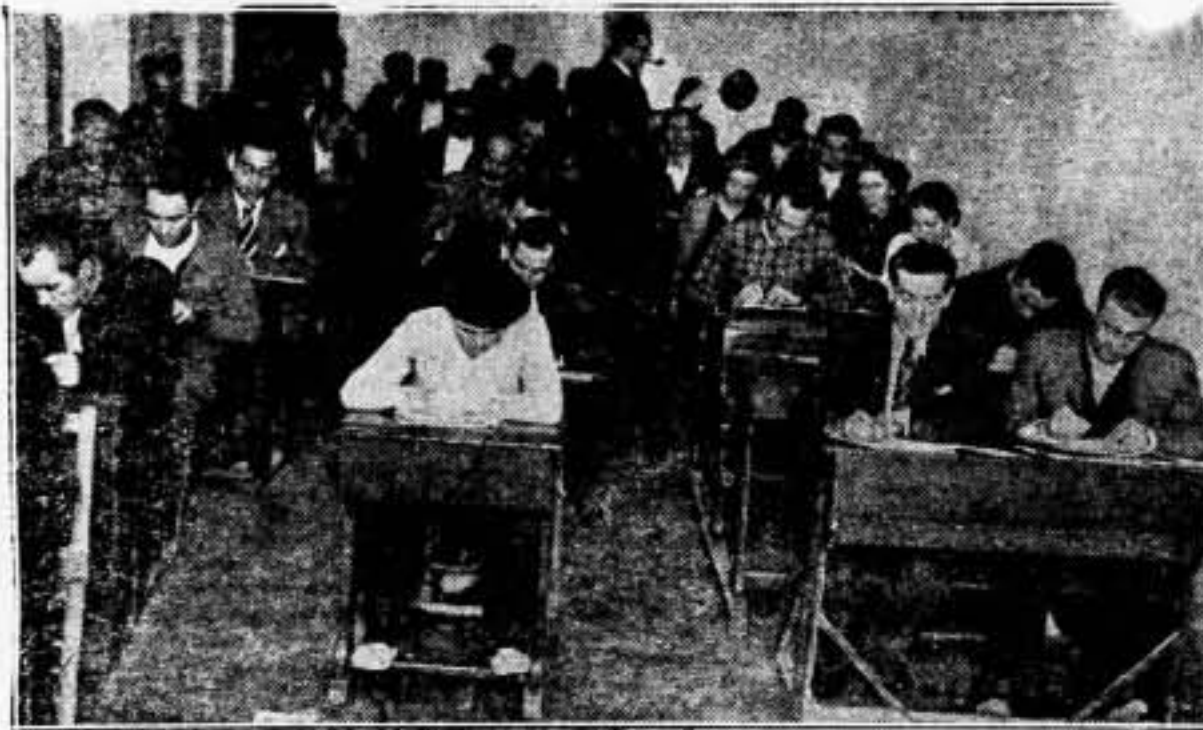
Hombres y mujeres del campo levantino, adquieren la base técnico-cultural para la dirección de la nueva Economía

La Colectividad agrícola es la expresión del comunismo naciente