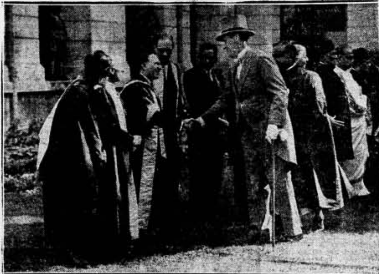
Lord Linlithgow, el virrey de la India acompañado de su ayudante, saluda a los delegados que han llegado para asistir al Congreso de los sabios indios en Calcuta y que tiene lugar en la Facultad de Ciencias Naturales