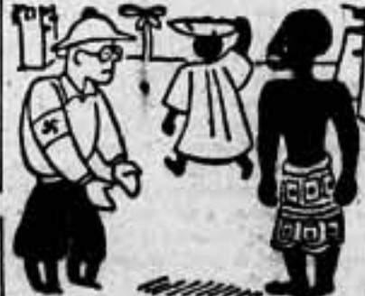
...Cuando Alemania recupere sus colonias, Hitler no solamente las salvará del comunismo, sino que las convertirá en grandes y hermosos rubios arios (De "L'Humanité")

Un chino me dice: —Oye... y yo le respondo: —¿Calla! —Ese nombre de Konoje ¿no se parece a Canalla? —Como un huevo a una castaña. —Le digo— que por mí mal todos están en España... ¡En la España circelal! Y el Konoje del Japón en algo se le parece a la canalla que crece cada día en mi nación. Que si allí nacen los soles aquí hacemos de uno dos: los canallas españoles son más canallas que Dios.