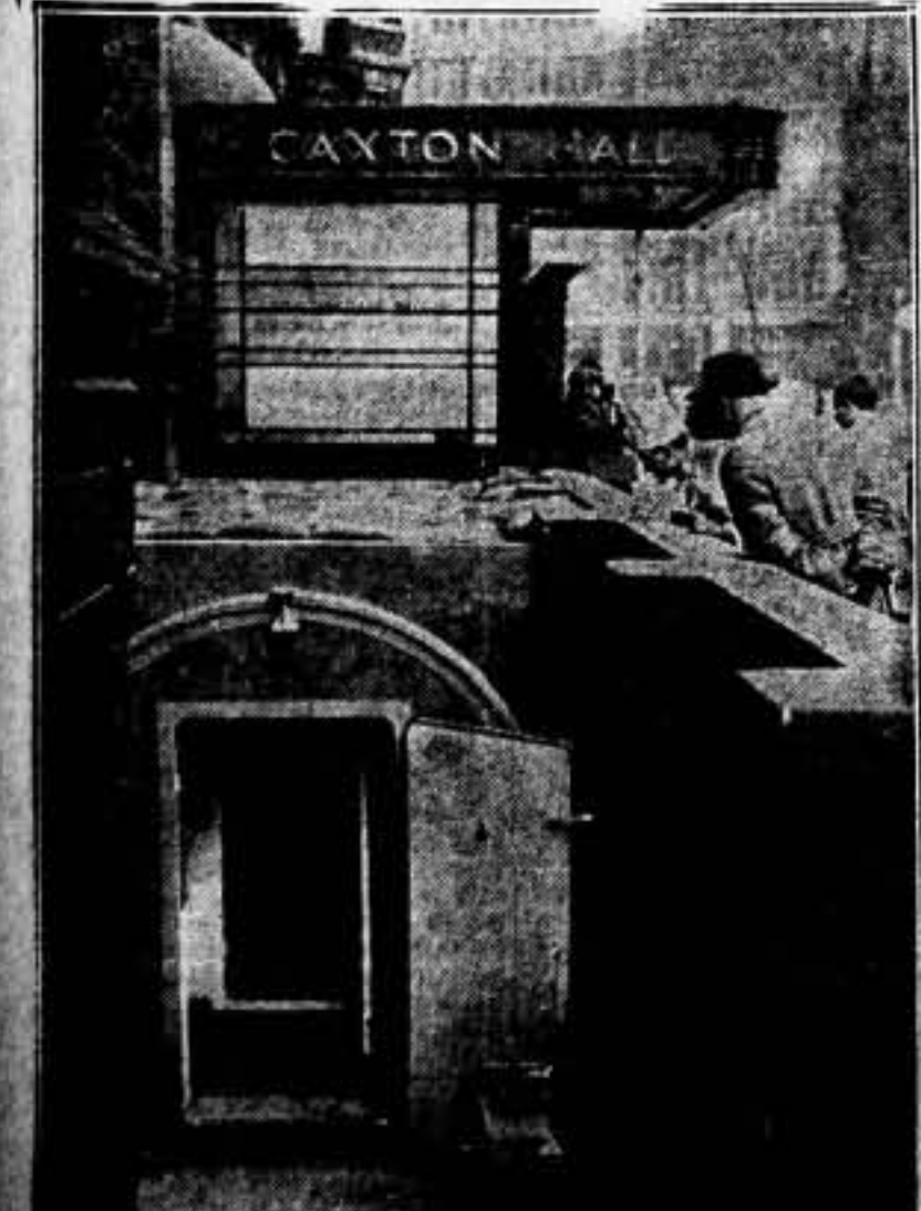
En el centro de Londres, acaba de construirse un refugio de acero en forma de túnel, y cuya profundidad pasa de los nueve pies. Aseguran que dicho refugio es inmune a los ataques de metralla y toda clase de bombas aéreas. Su construcción demuestra que los ingleses se preparan "por si las cosas..."