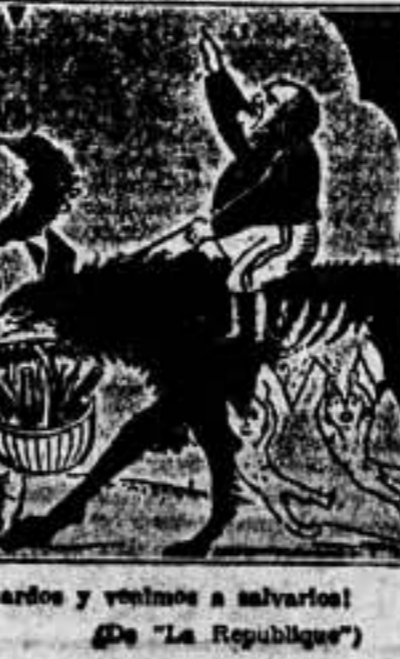
¡Somos dos buenos Sanbernardos y venimos a salvarlos!

Por lo tanto, el Gobierno británico está decidido a conservar en vigor estos principios y a prestar toda su ayuda para hacer que este instrumento en la medida que lo permitan las circunstancias.