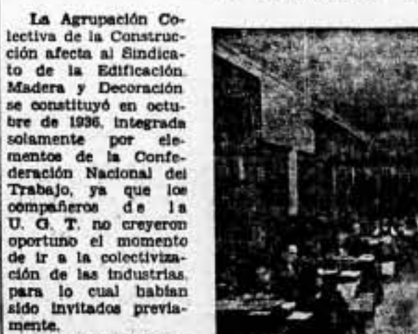
Las oficinas de la Agrupación Colectiva de la Construcción

La Agrupación Colectiva de la Construcción afecta al Sindicato de la Edificación, Madera y Decoración se constituyó en octubre de 1936, integrada solamente por elementos de la Confederación Nacional del Trabajo, ya que los compañeros de la U. G. T. no creyeron oportuno el momento de ir a la colectivización de las Industrias, para lo cual habían sido invitados previamente.