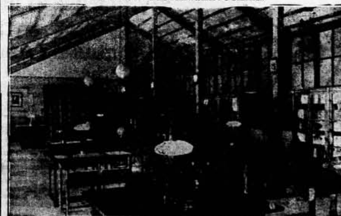
Una vista de la magnífica biblioteca inaugurada en el cuartel "Fermin Salvochea"