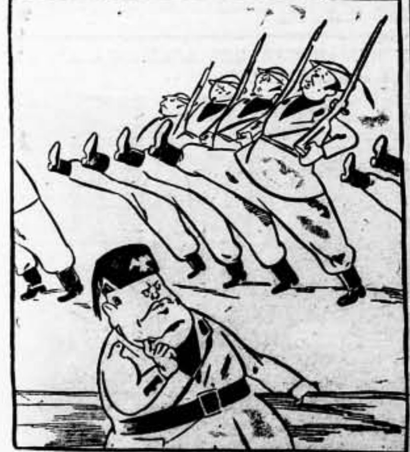
—Así, al menos, ya están entrenados para cuando en España los ligeros "cortar la pata".