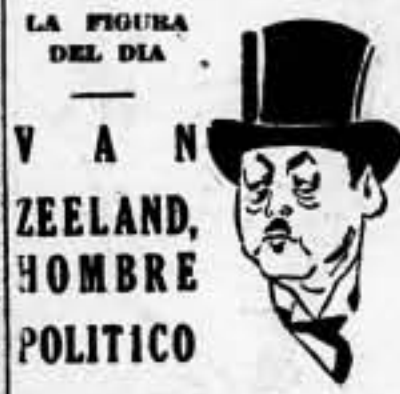
LA FIGURA DEL DIA