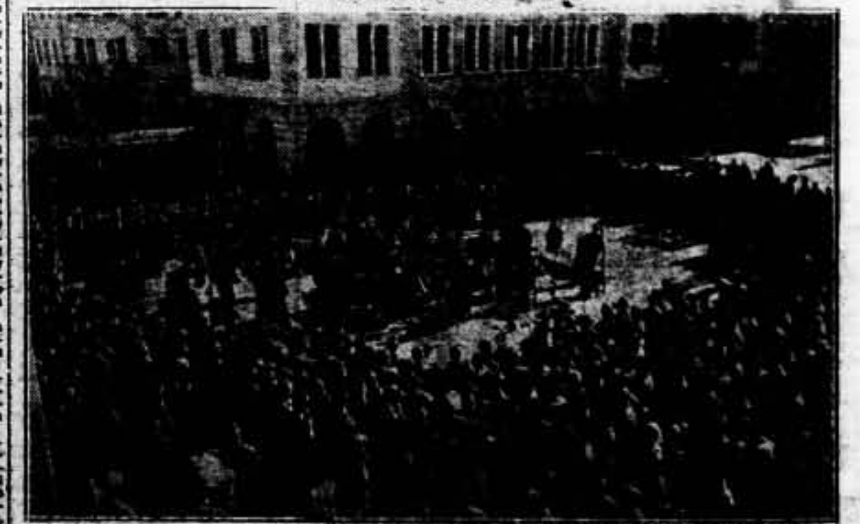
La Banda Municipal de Barcelona interpretando en esta obra en el patio del cuartel «Fermín Salvóchea», con motivo de la inauguración del «Hogar del Soldado»