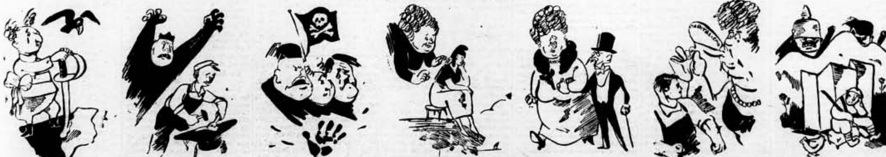
Francia nos da la castaña y empieza a gemir España. La ambición de los bandidos nos coge desprevenidos. Y otros pueblos bandoleros se aproximan los primeros. Para dar el empujón viene la "no interferencia". A la que con el curita se unió el Gobierno de Francia. Esto de la "no injerencia" Esto de la "no injerencia". Porque siempre llega tarde a la batalla el cobarde.