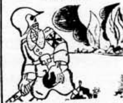
—España será mía o de nadie!