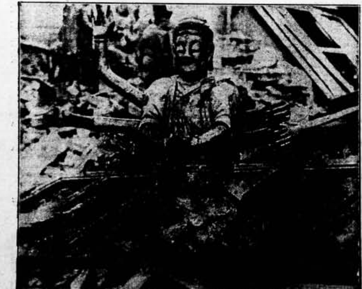
Las ciudades de China también sufren los horrores de los bombarderos aéreos. En esta "foto" podemos ver los edificios caídos por las bombas en un templo budista, cuando se le cayó encima de los "seis brazos".