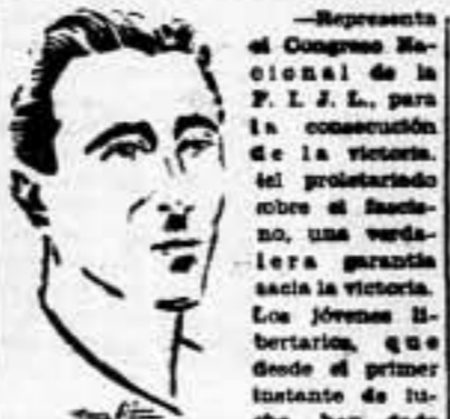
Representa el Congreso Nacional de la F. I. J. L. para la consecución de la victoria del proletariado sobre el fascismo, una verdadera garantía para la victoria.