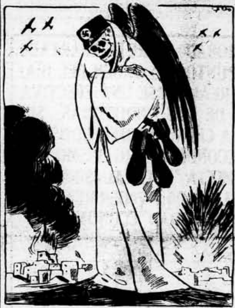
—En el "ojo por ojo y diente por diente", siempre saldrán defraudados los antifascistas.