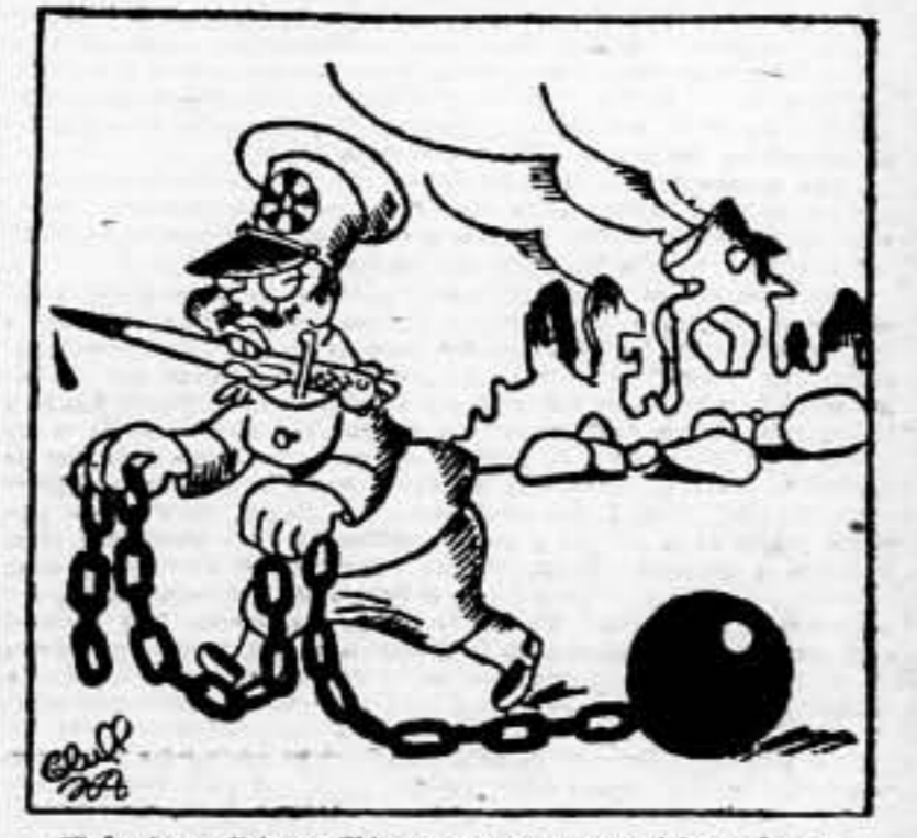
El Japón se dirige a China con nuevas proposiciones de paz (De «La Correspondencia de Valencia»)

LA «BUENA VOLUNTAD» NIPONA El decreto anunciando la convocación de nuevas elecciones no fija fecha para la celebración de las mismas aunque la Constitución establece que deben tener lugar, lo más tarde, a los dos meses de firmado el decreto anunciando la consulta electoral. En los círculos oficiales se expone el convencimiento de que dos meses será plazo suficiente para reducir a la mayoría absoluta del partido waldista y podrá decretarse la fecha de la consulta general. En todo el país la efervescencia política es muy intensa y los incidentes continuos. Las precauciones adoptadas por las autoridades son extraordinarias. — Cosmos. HITLER FINANCIA EL MOVIMIENTO FASCISTA CHECO-SLOVACO Praga, 3. — La Prensa denuncia que los sudetas recibieron durante el pasado otoño una suma global de cerca de tres millones de coronas, en pequeños billetes, procedentes de la central nacional socialista de Munich. — Cosmos.