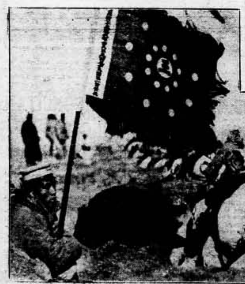
Tropas chinas del Ejército del Norte, en una de las avanzadas más cercanas de la línea enemiga, esperan órdenes para comenzar un contraataque

DE LA HEROICA RESISTENCIA CHINA AL NORTE DE HANKEU